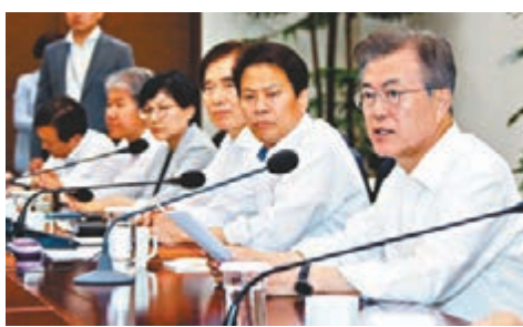
■文在寅(右一)為美朝峰會牽線，與幕僚開會商議。