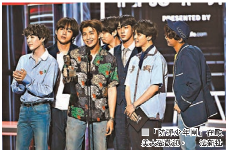
■「防彈少年團」在歐美受歡迎。

韓國男子組合「防彈少年團」(BTS)最新韓語大碟，前日成功登上美國Billboard 200大碟榜榜首，是首次有K-pop歌手或組合得到如此佳績。Billboard表示，今次是相隔12年後，首次有外語專輯登上大碟榜冠軍，再次顯示韓流的威力。