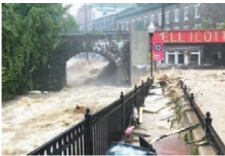
■馬里蘭州近日暴雨成災。