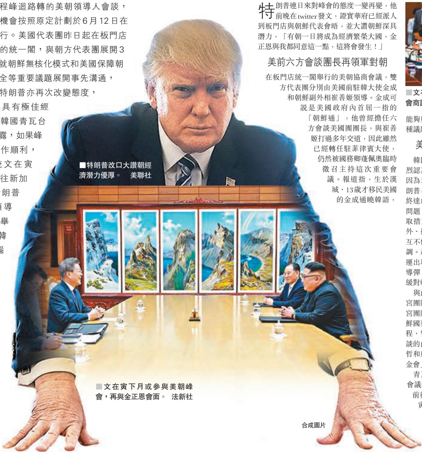
■特朗普改口大讚朝經濟潛力優厚。

籌備過程峰迴路轉的美朝領導人會談，愈來愈有機會按照原定計劃於6月12日在新加坡舉行。美國代表團昨日在板門店朝鮮一側的統一閣，與朝方代表團展開3日協商，就朝鮮無核化模式和美國保障朝鮮體制安全等重要議題展開事先溝通，美國總統特朗普亦再次改變態度，盛讚朝鮮具有極佳經濟潛力。韓國青瓦台消息則透露，如果峰會準備工作順利，韓國總統文在寅有可能前往新加坡，與特朗普和朝鮮領導人金正恩舉行美朝韓三方首腦會談。