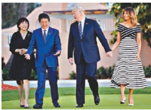
■安倍上月偕妻訪美會特朗普。資料圖片