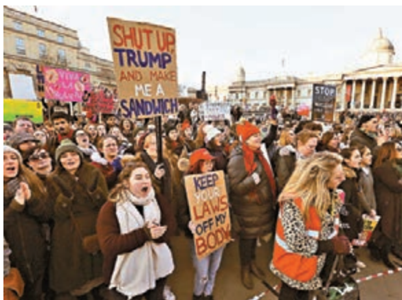
■倫敦曾發生反特朗普示威。資料圖片

美國總統特朗普將於7月出訪英國，據報英國首相文翠珊計劃建議特朗普屆時避免前往倫敦市中心，兩人改為在郊區會面，以避開可能出現的大規模反特朗普示威。