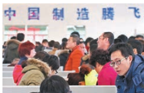
山東煙台舉辦全球精英創業大賽招賢。圖為煙台舉行招聘會。

香港文匯報訊 在各出奇招、搶攬人才之際,山東煙台定於5月至8月舉辦「2018年中國·煙台海內外精英創業大賽」,並首次在歐洲、北美洲和亞洲設立海外分賽場,貼出「招賢榜」,意在邀請海內外精英攜項目參賽,來煙台創新創業,助力打造先進製造業名城。煙台市委常委、常務副市長王中日前在北京舉行該賽事新聞發佈會上表示,歡迎香港精英投身煙台創業大潮,積極參與海洋科技、生物醫藥、節能環保等領域的發展大計。