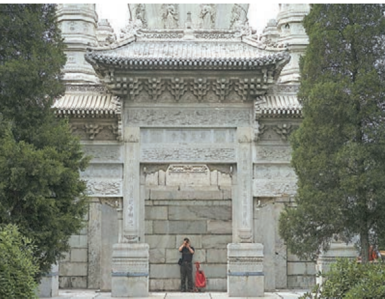
北京藏傳佛教寺院西黃寺首次開放予公眾參觀。

城塔下,老人告訴記者,和城內多數磚石、木質結構的古塔不同,清淨化城塔是少見的漢白玉石佛雕塔,工藝水平極高、保存完好。她期待一睹這座「神秘的」古塔真容已有多年。隸屬中國藏語系高級佛學院 鄭大慶說,在清代,西黃寺是直轄理藩院的皇家寺院,記載了西藏地方政府與清中央政府數百年往來的歷史事實,和藏傳佛教多位大活佛和高僧愛國愛教、護國利民、維護祖國統一與民族團結的不朽功績。據工作人員介紹,西黃寺博物館隸屬於中國藏語系高級佛學院,佔地約2萬餘平方米,常設展覽有六世班禪與西黃寺展、藏傳佛教學術制度展、乾隆御筆石刻拓片展、清淨化城塔專題展等,臨設展覽有唐卡展、佛教文化陶瓷展。該博物館在工作日時,主要作為佛學院學員現場教學及相關活動的主辦場所;周末,則以博物館的形式面向社會公眾。