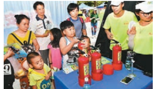
廣州未成年人接受安全教育。

香港文匯報訊(記者敖敏輝廣州報道)由廣州團市委、市政法委、市未成年人保護委員會辦公室等12家單位主辦的2018年廣州市未成年人保護宣傳周(以下簡稱「未保宣傳周」)啟動儀式昨日在廣州市兒童公園舉行。廣州將通過政策法規宣講、專家熱線答疑解惑、安全體驗日等9個活動,推動全社會參與未成年人保護工作。據悉,當日,包括中國工程院院士鍾南山在內的14名社會知名人士,成為廣州未成年人保護形象大使。除了鍾南山院士,此次廣州未成年人保護形象大使還包括粵劇表演藝術家、廣東省戲劇家協會榮譽主席倪惠英,教育部法學國家級實驗教學示範中心(中山大學)主任、中山大學法學院楊建廣教授,中國青年五四獎章獲得者、暨南大學體育學院副教授、「亞洲飛人」蘇炳添等。他們將為廣州未成年人保護事業「代言」,發揮自身的正能量。