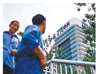
美媒指美商務部已就解除對中興公司的銷售禁令通報美國國會。

作為交換，特朗普將解除此前對中興向美國企業採購產品的禁令。特朗普也在自己的推特上公佈了和中興達成的這一協議，同時還不忘戳一戳自己的「對頭」：美參議院民主黨領袖舒默和前任奧巴馬。