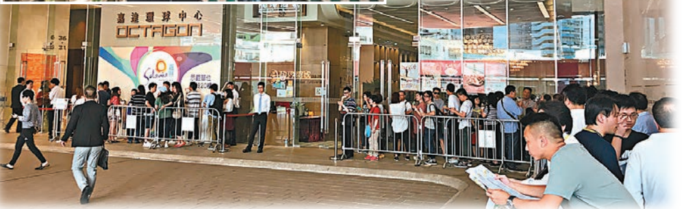
■嘉熙昨日料錄約5,000人次睇樓參觀。