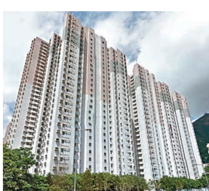
■龍門居再創屯門居屋二市場呎價新高。資料圖片

該屋邨近年鮮見490方呎大單位綠表成交，對上一宗為去年初錄得的188萬元(未補價)，一度創該屋邨二手公屋價新高，相隔近一年半，該紀錄被推高23%。原業主於2005年僅以15.13萬(未補價)購入上址，持貨13年間單位大幅升值逾14倍。