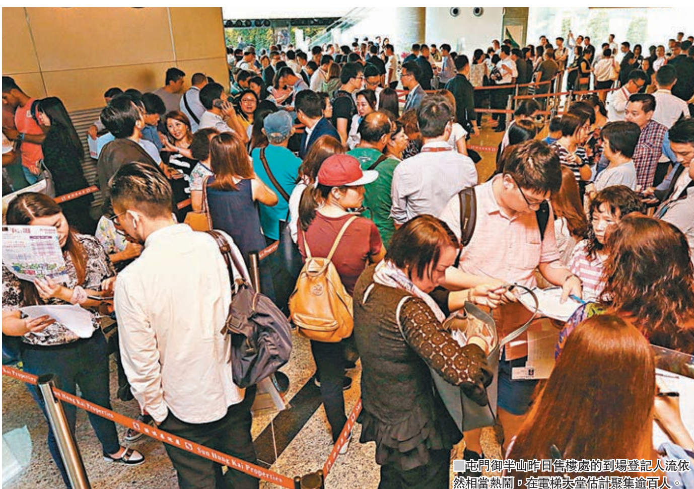
■屯門御半山昨日售樓處的到場登記人流依然相當熱鬧，在電梯大堂估計聚集逾百人。

據香港文匯報綜合市場消息所統計，本月截至昨日(26日)新盤市場累計錄得約1,200宗成交，較4月全月約600宗，已多出一倍。究其原因，今年4月缺乏全新大型樓盤開售，多個樓盤至本月才展開銷售，包括現時撐起大市的屯門御半山。