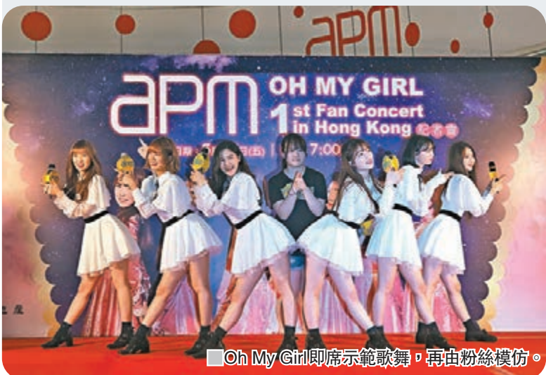
Oh My Girl 即席示範歌舞，再由粉絲模仿。

Oh My Girl 其後在台上與粉絲大玩遊戲，與粉絲按指示卡擺出 Oh My Girl 的招牌姿勢。之後，司儀更邀請 Oh My Girl 即席示範《Monkey》、《Liar Liar》中的歌舞，再由粉絲模仿，玩得非常開心！活動尾聲，Oh My Girl 也很識做，到台下與粉絲合照，並即席用剛學到的廣東話跟粉絲說「我愛你」，引得粉絲尖叫連連。