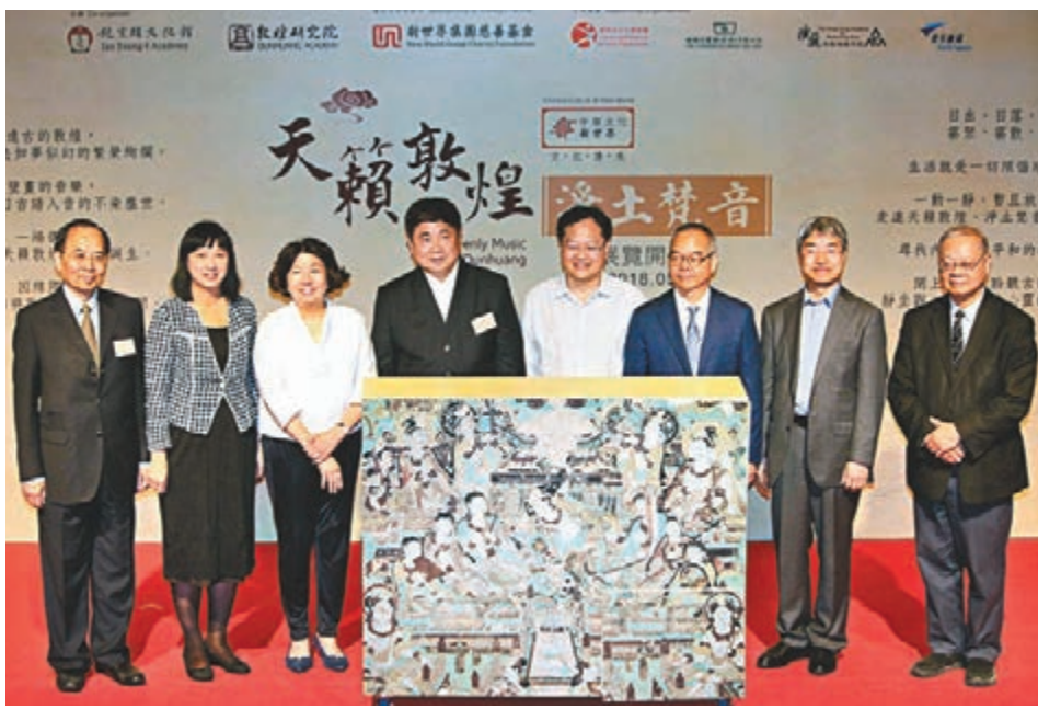
一眾主禮嘉賓共同拼出敦煌壁畫，為展覽揭幕。

「天籟敦煌樂團」以「古曲新詮，古譜入音」，致力透過音樂弘揚敦煌文化，日後亦希望樂團能走進學校，以音樂作為教育和傳承，提高中樂在香港的地位。