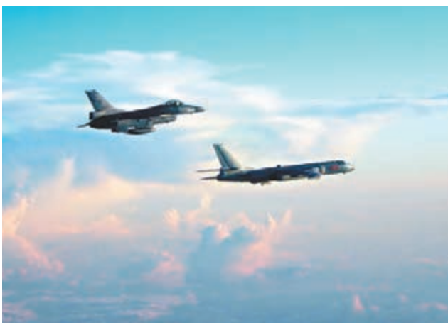
台防務部門昨日公佈台F-16戰機和轟-6K的「合影」。

台防務部門11日回應稱「全程掌握」解放軍此次行動，並首度公佈台F-16戰機和轟-6K的「合影」及監控轟-6K掛彈飛行的視頻。 對於解放軍軍演和空軍繞島飛行，國台辦曾明確表示，這些傳達的信息是十分清晰和明確的，就是針對「台獨」分裂勢力及其活動所作出的強烈警告，展現了我們維護國家主權和領土完整的決心和能力。我們有堅定的意志、充