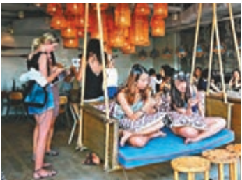
■沙灘食肆受惠炎熱天氣，生意暢旺。

灘人流有所增加，「去年是到暑假才開始多人，今年市民提早到了沙灘玩，沙灘在上星期已經開始多人，當中除了有旅客外，亦有不少本地市民。」他指出不少人都會租用浮床，認為炎熱天氣對生意有幫助。