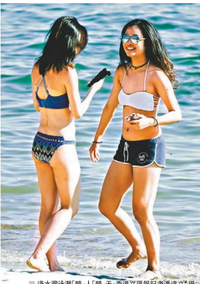
■淺水灣泳灘「酷」人「酷」天。

酷熱天氣下有機會出現中暑情況，當體溫升至攝氏41度或以上時，患者或出現全身痙攣或昏迷等現象，若不及時降溫及急救會有生命危險。衛生署衛生防護中心建議市民應經常留意天文台發出的天氣警告，並採取預防措施，包括穿著淺色、不束身和通爽的衣服，以減少身體吸熱，方便排汗及散熱；避免喝咖啡或因酒精的飲品，因為會加速身體水分透過泌尿系統流失等。中心並建議市民不應在酷熱天氣下作長程的登山或遠足等活動，最好安排在早上或下午較後的時間進行戶外活動；進行活動時若感不適，應立刻停止並盡快求診。