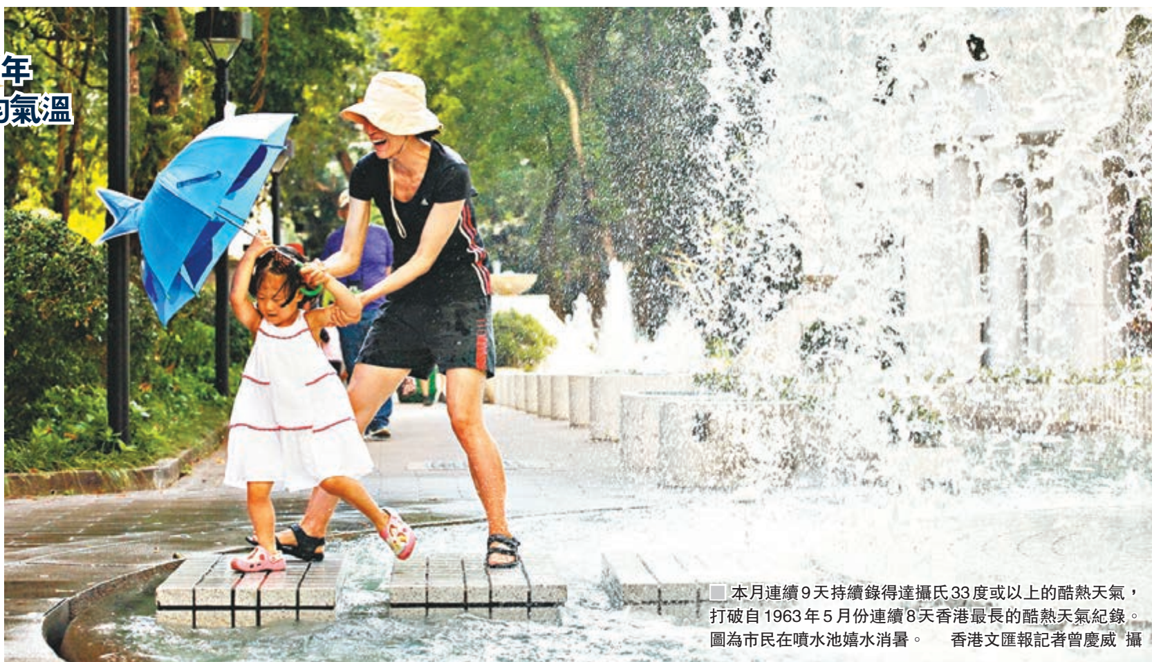
■本月連續9天持續錄得達攝氏33度或以上的酷熱天氣，打破自1963年5月份連續8天香港最長的酷熱天氣紀錄。圖為市民在噴水池嬉水消暑。

註：2018年數字只計算至5月24日 資料來源：天文台 整理：香港文匯報記者 文森