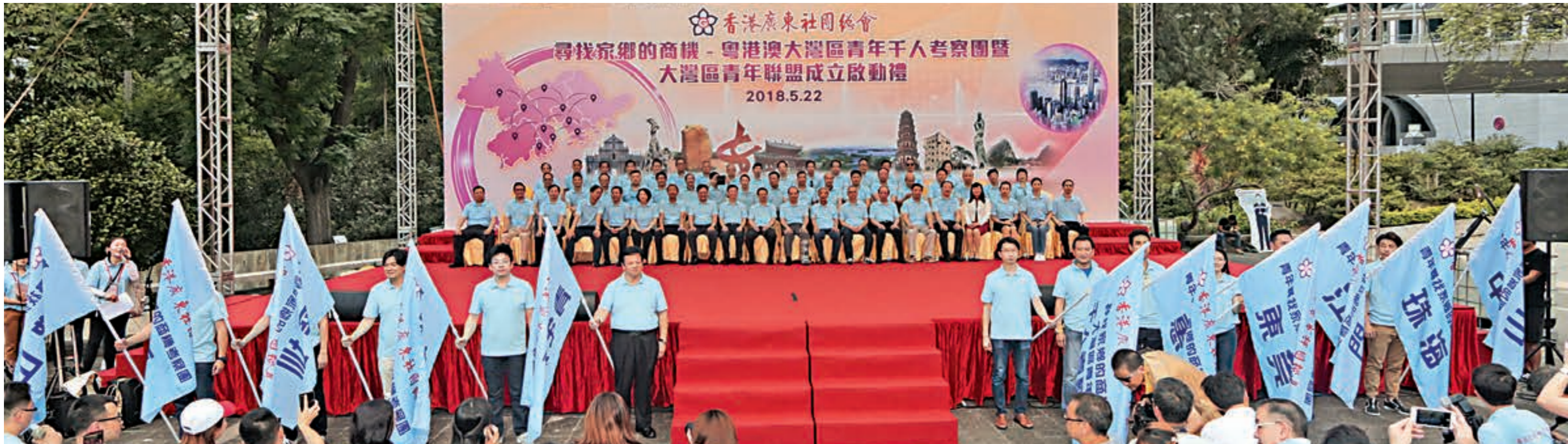
▲尋找家鄉商機 大灣區青年千人考察團暨大灣區青年聯盟成立啟典禮