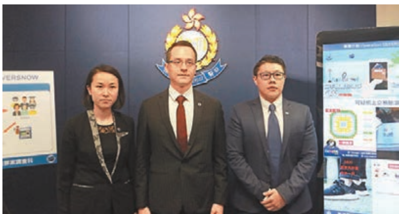
警方破獲4個詐騙集團,共拘捕20人。

警方接受香港文匯報查詢時表示,警隊非常重視人員的操守,絕不容忍和姑息任何人員干犯違法行為,定必嚴正處理,進行刑事調查及紀律覆檢。