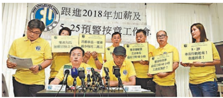
九巴僱員工會宣佈參加「有限度按章工作」。

前造成多人死傷的大埔巴士嚴重車禍,不可能立刻睡覺,哪有充足休息時間?他們在要求最高工時12小時的同時,還要求今年全體員工加薪12%及月薪車長最低月薪23,000元,以追上其他重型車司機的薪金水平。