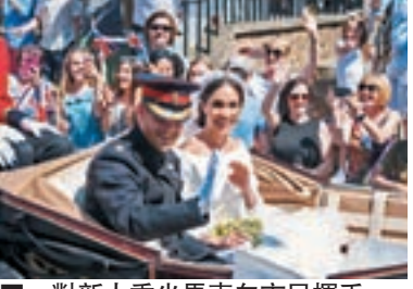
一對新人乘坐馬車向市民揮手。

即使將來查爾斯繼位，她也不能享有「王后陛下」稱號。但對真心相愛的人來說，這些名號與其說是「榮譽」，不如說是「枷鎖」。 戴安娜當年結婚時才二十歲，又是嫁給大她十三歲的查爾斯。作為一位來自離異家庭的懷春少女，她對婚姻顯然期望過大，也不無依賴感。其羞澀的笑臉和膽怯的表情雖惹傳媒好感，卻無法理解丈夫深沉的心思，天真的女人做出很多以為可以吸引丈夫的言行，結果適得其反，以致悲劇收場。 可幸，兩位兒媳婦都受過大學教育，婚前也有一定的人生閱歷，所以，表現得比較成熟和自信。她們面對傳媒刁鑽的問題時，都能應付自如。梅根那種接近邊緣的成長經歷和獨立自主的奮鬥精神，可能更迎合今日平權聲高漲的社會風氣。 她得以「入宮」，有助王室建立開明形象；在時尚界，則展示另類美或個性美，難怪有黑人說看完婚禮後有了「歸屬感」。可見，「卑微」的梅根已成為活脫脫的公關招牌。