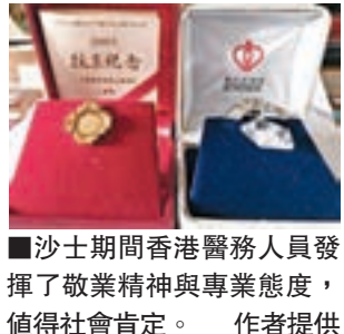
沙士期間香港醫務人員發揮了敬業精神與專業態度，值得社會肯定。

也有的醫生太太在這段沙士期間對丈夫特別的溫柔體貼，幫他洗澡，替他按摩，一起吃飯，一起睡覺。意思就是，給他最好的精神支持，讓他有能量去打仗，萬一打輸了，就一起犧牲吧！ 有一位小朋友在學校的周記裡，這樣寫着：「晚上我睡覺前，經過爸媽的臥房，聽到爸爸媽媽說，妳要好好照顧家裡的老人，要把孩子們扶養長大！媽媽小聲地哭了……」 2003年6月23日當世衛宣佈沙士疫區在香港已經取消後，每個人都喘了一口氣，如釋重負，朋友相互見面頗有劫後餘生之感，市面又漸漸興旺起來。如今回想起沙士之疫帶給香港市民的是什麼？第一，對防禦病菌的警覺性高了，凡是咳嗽噴嚏就需自覺地戴上口罩；第二，已經習慣以1：99清潔家居；第三，平時勤快洗手；第四，習慣了使用公筷公匙。這是香港地區飲食習慣的一個很大進步，台灣早在上世紀70年代後期已盛行使用公筷公匙，在這方面，有關公共衛生的觀念，內地尚未普及走入平常百姓家。