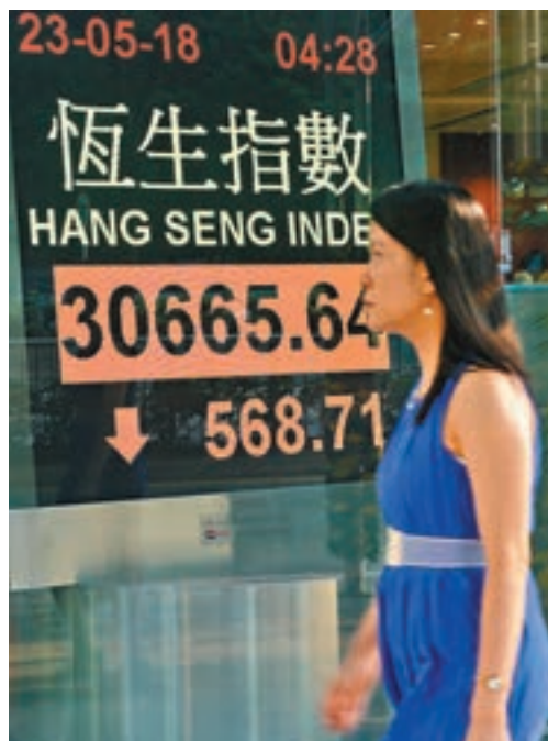
恒指昨日下午跌568點。

正當市場認為中美貿易摩擦有望暫停之際,特朗普昨日的言論又再令市場起波瀾。他一時聲稱對中美貿易談判不滿意,又指與朝鮮的峰會可能要押後,資金唯有傾向避險,日股跌近1.2%,是連跌第二日,馬來西亞股市更大跌逾2%,滬指跌1.4%,創逾一個月最大跌幅,並跌穿3,200點大關。