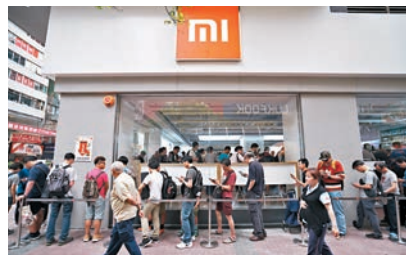
市場消息指,小米兩周內開始上市路演。

另外,有報道指,內地中國預託證券(CDR)即將出台,試點細則準備已到位,相關部門正加快出清進度,料最快可以在一個月內看到首間申請以CDR上市的企業,而市傳百度將是首間以CDR回歸A股的企業。百度創始人李彥宏早前接受訪問時曾指,一直希望百度能夠在內地上市,因為百度主要的用戶和市場都在中國,如果主要股東也在中國就是最理想的情況。