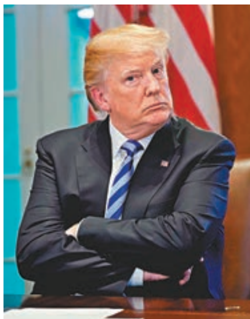
美國總統特朗普成為環球股市最不穩定的因素之一。