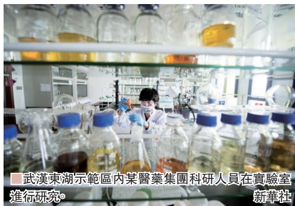
武漢東湖新區內某醫藥集團科研人員在實驗室進行研究。

「隨着化解系統性金融風險攻堅戰的推進，政府強力推動資金從炒房地產等虛擬投資退出。這些資金如果不加以妥善引導，可能會衝擊金融市場，帶來其他資產價格的暴漲暴跌，形成新的系統風險。」全國政協委員、北京大學光