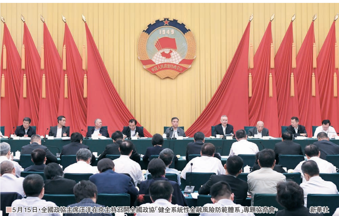
5月15日，全國政協主席汪洋在京主持召開全國政協「健全系統性金融風險防範體系」專題協商會。

「中國房地產市場已從總量供不應求轉向供求總體平衡、結構性區域性矛盾突出的新階段，供需形勢和主要矛盾的新變化，使潛在風險進一步積累。」全國政協委員、國務院發展研究中心副主任王鳴認為，要加快健全與長效機制對接的基礎性制度，逐步調整退出與長效機制不適應的政策和限制性調控措施，有效防範房地