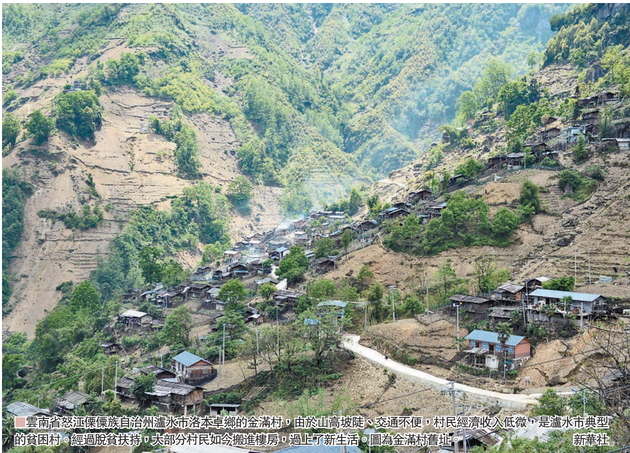
雲南省怒江傣族自治州瀘水市洛本卓鄉的全滿村，由於山高坡陡、交通不便，村民經濟收入低微，是瀘水市典型的貧困村。經過脫貧扶持，大部分村民如今搬進樓房，過上了新生活。圖為全滿村舊址。新華社

脫貧攻堅的主要難點是深度貧困，要確保2020年脫貧摘帽，任務艱巨。地處中國西南邊陲要地的雲南，目前就正處在脫貧攻堅的關鍵時刻。近日，由全國政協副主席盧展工率隊，全國政協社會和法制委員會牽頭組織的調研組就「解決深度貧困地區脫貧問題」前往雲南昆明、怒江州等地調研。「我們這次調研就是想與群眾面對面，看真實的情況，聽真實的聲音。」盧展工叮囑村幹部和扶貧工作隊員，要落實好扶貧政策，注重發揮群眾的主體作用，提高組織化程度，把能用的地都用起來，如果村民們腦子裡開始有想法，願意去幹活，那麼脫貧就有希望。