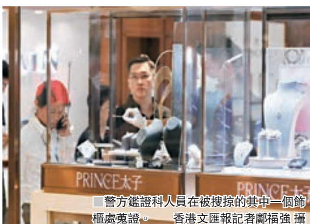
警方鑑證科人員在被搜掠的其中一個飾櫃處蒐證。

珠寶估計總值約500萬元,他又指最重要是沒有店員及顧客受傷。 5個月內第三宗涉鐵鎚劫案 連同是次劫案,涉及鐵鎚劫店舖案在今年短短5個月內已發生3宗。本年3月26日一間位於中區威靈頓街的珠寶店,遭3名疑來自南美洲的男子,在數十秒內用兩把大鐵鎚撲爛櫥窗,掠走4,000萬元珠寶鑽飾。警方事後在附近拘捕其中一名劫匪,其後再拘捕其餘兩名疑匪。同年2月6日,元朗日新街一間二手名錶店,亦遭3名南亞裔匪徒行劫,以鐵鎚擊爛櫥窗玻璃,掠去約60隻總值逾100萬元名錶逃去,過程僅約15秒。