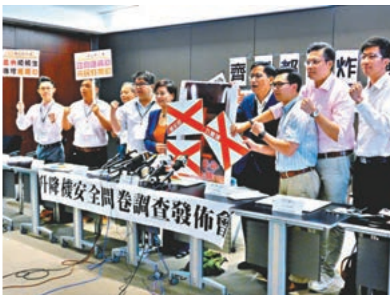
西九新動力調查發現,近七成九龍西舊樓居民認為大廈需要更換升降機。

撥款資助,鼓勵加快推動升降機優化工程。 文件解釋,現時市建局「樓宇維修綜合支援計劃」、屋宇署「樓宇安全貸款計劃」及房協「長者維修自住物業津貼計劃」,都為有需要優化或更換升降機的業主提供財政支援,但業主或因應樓宇情況,傾向將有關財政支援集中處理其他公用地方的維修或改善工程,而非升降機優化工程。現有的財政支援水平或不足以進行升降機優化工程,可能對缺乏經濟能力的業主帶來額外負擔。 機電署又指,為進一步推動優化工程,會着手研究強制實施優化升降機工程的可行性,參考其他國家的相關經驗、本地類似法例的實施及執行情況,以及考慮社會及業界的承受力,適時諮詢公眾、議員及業界的意見,並提交建議。 署長:不宜一刀切加組件 機電署署長薛永恒出席升降機及自動梯安全諮詢委員會會議後表示,香港不少升降機已老舊,並無符合最新安全標準的組件,委員會支持研究如何協助有需要業主為升降機加裝安全組件,以提升安全系數。 他認為,按升降機機齡一刀切加裝組件未必合適,因為可能有業主已自願為升降機加裝符合國際要求的安全組件,並強調應以升降機是否符合國際最高要求為基準。