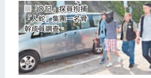
「O記」探員拘捕「人蛇」集團一名骨幹成員調查。

香港文匯報訊(記者蕭景源)俗稱「O記」的警方有組織罪案及三合會調查科關競斌警司表示,警方根據線報及與內地執法機構情報交流,獲悉有人安排由內地安排越南人,經由水路偷渡來港,遂聯同水警及廣東省邊防總隊與水警人員,於前晚8時許展開代號「雷霆18」行動。 其間,本港警方在西貢一帶目標地點的海邊埋伏監視。及至昨日清晨晨6時許,「O記」探員趁「蛇頭」用的士運載「人蛇」往市區時採取拘捕行動,先在西貢早禾坑截獲一輛目標市區的士,當場拘捕5名越南「人蛇」及男司機。 另一隊探員則在萬宜水庫路截獲另一輛新界的士,拘捕車上共兩名持雙程證內地男子及男司機。其後探員再掩至東壩截獲一名越南「人蛇」及一名持雙程證的內地人及一名持「行街紙」的越南人。 據悉,被捕的越南「人蛇」,多由越南偷渡進入廣西一帶後,再前往廣東與「蛇頭」接觸安排偷渡來港。調查相信剛被捕的「人蛇」前日乘船在西貢浪茄灣一帶登岸後,估計部分人會先到市區親友家暫避,其後再做黑工或自首申請酷刑留港等。