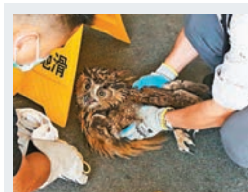
貓頭鷹獲救。

香港文匯報訊(記者蕭景源)俗稱「女人街」的旺角通菜街介乎豉油街與登打士街一段路面,昨夜凌晨罕有地同時有地底鹹水管及食水管爆裂,大量鹹淡水湧出地面,由於水力猛烈,沖走大量沙石,令路面被出現一個直徑約3米的大坑,受封路搶修影響,附近百多個小販排檔未能營業,水務署估計至今日清晨完成修復,其間附近樓宇暫停供應鹹水,但食水不受影響。 昨日凌晨3時許,旺角通菜街2號近豉油街對開,兩條位於馬路中央地底的鹹水管及淡水管疑同時爆裂,大量鹹淡水夾雜沙泥湧出路面,令附近路面出現水浸,途人見狀報警。水務署人員接報到場,馬上關上水掣,惟現場路中已被沖出一個直徑約3米、深約1米的大坑。 經初步調查,水務署相信是一條直徑15吋鹹水管及一條直徑6吋食水管爆裂,需即時進行搶修工程,估計要到今日清晨6時左右才能完成。其間受封路影響,除交通需改道,附近部分樓宇暫停供應鹹水外,通菜街介乎豉油街與登打士街之間共約100多個排檔無法開檔。 一名在豉油街擺攤的檔主表示,他好彩並無受爆水管影響,「女人街」的生意及人流亦未見與日常有很大分別;另有附近食店職員表示,生意未有受封路而有太大影響,但指排檔商戶平日用鐵板覆蓋渠口位置,令街道有老鼠出沒。他指今次爆水管令當局需清理渠口位置,對街道衛生問題有幫助。