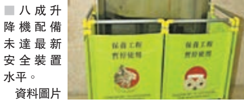
八成升降機配備未達最新安全裝置水平。

陳克勤促設20億維修基金 他要求特區政府成立20億元的升降機維修基金,資助業主更換或優化升降機。 林鄭月娥回應說,特區政府願意作出政策和財政上的承擔,繼樓宇更新大行動「1.0」、「2.0」和資助小業主處理樓宇消防安全後,去處理香港樓宇的升降機安全問題。 機電工程署則於昨日向立法會提交的文件指出,現時香港約有6.6萬部升降機,當中約八成配備未達至現今最新安全裝置水平,優化升降機屬自願性。 自2011年起至今,只約有5,200部升降機進行不同程度優化工程,進度不顯著。 根據機電署資料,有八成升降機未有安裝俗稱「夾纜」的剎停裝置,以防止機廂不正常移動,並有近六成升降機沒有安裝雙重制動系統,七成七無防止機廂向上超速的裝置。 機電署研短中長策增安全 文件指,機電署正計劃制定短、中及稍為遠期的措施,以提升舊式升降機安全,包括在本年度增加人手,加強對舊式升降機的巡查,亦會增加對相關保養項目的抽查,以及研究改善記錄升降機承辦商保養工作的日誌格式。 政府並正考慮向有需要樓宇的業主提供經濟誘因,包括參照現時推行的「樓宇更新大行動2.0」及「消防安全改善工程資助計劃」,研究