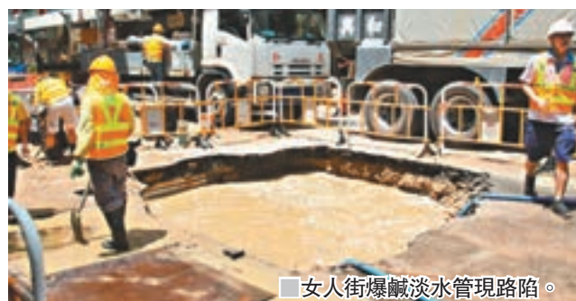
女人街爆鹹淡水管埋路陷。

香港文匯報訊(記者蕭景源)俗稱「女人街」的旺角通菜街介乎豉油街與登打士街一段路面,昨夜凌晨罕有地同時有地底鹹水管及食水管爆裂,大量鹹淡水湧出地面,由於水力猛烈,沖走大量沙石,令路面被出現一個直徑約3米的大坑,受封路搶修影響,附近百多個小販排檔未能營業,水務署估計至今日清晨完成修復,其間附近樓宇暫停供應鹹水,但食水不受影響。 昨日凌晨3時許,旺角通菜街2號近豉油街對開,兩條位於馬路中央地底的鹹水管及淡水管疑同時爆裂,大量鹹淡水夾雜沙泥湧出路面,令附近路面出現水浸,途人見狀報警。水務署人員接報到場,馬上關上水掣,惟現場路中已被沖出一個直徑約3米、深約1米的大坑。 經初步調查,水務署相信是一條直徑15吋鹹水管及一條直徑6吋食水管爆裂,需即時進行搶修工程,估計要到今日清晨6時左右才能完成。其間受封路影響,除交通需改道,附近部分樓宇暫停供應鹹水外,通菜街介乎豉油街與登打士街之間共約100多個排檔無法開檔。 一名在豉油街擺攤的檔主表示,他好彩並無受爆水管影響,「女人街」的生意及人流亦未見與日常有很大分別;另有附近食店職員表示,生意未有受封路而有太大影響,但指排檔商戶平日用鐵板覆蓋渠口位置,令街道有老鼠出沒。他指今次爆水管令當局需清理渠口位置,對街道衛生問題有幫助。