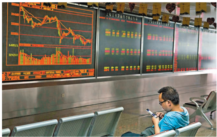
通信、5G板塊昨天急升，滬指V形反轉並奪回3,200點大關。

另外，中國證監會網站周一晚發佈會議新聞稿稱，證監會研究建立上市公司ESG(環境、社會和公司治理)報告制度，持續強化上市公司環境和社會責任方面的信息披露義務。在IPO、再融資和併購重組審核中，要進一步加大對環保問題的重點關注。積極支持符合條件的綠色企業利用資本市場做強做優做大，大力發展綠色金融，完善綠色債券相關制度政策，擴大綠色公司債券試點，推動綠色債券市場健康發展，研究建立信用評級監管制度。