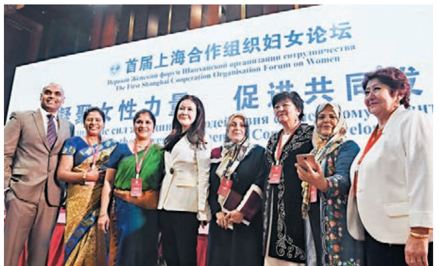
首屆上海合作組織婦女論壇在北京舉行，論壇嘉賓在開幕式後合影。

為共創和平、安寧、繁榮、開放、美麗的世界，與會人士建議，進一步加強上海合作組織婦女領域交流合作，積極搭建形式多樣的合作平台和網絡，大力開展能力建設、信息交流、良好範例推廣等務實合作，提高婦女進一步參與國家、區域和全球經濟社會發展的能力，各國婦女機構也要進一步加強交流合作，加強夥伴關係，攜手推進婦女發展。