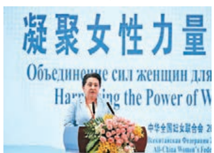
烏茲別克斯坦副總理兼婦女委員會主席布納爾巴耶娃出席開幕式並致辭。