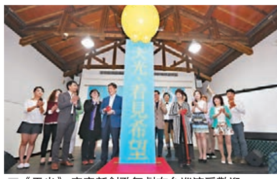
《天光》客家新創歌舞劇在台巡演受歡迎。

據介紹，該劇引用多位客家詩人、詞曲創作者的作品，並展現宗祠、子孫燈等客家精神的象徵。音樂節奏輕快、劇情生動，以情感貫串全劇，表現出客家語言文學之美。