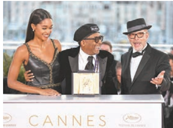
Spike Lee(中)憑《BlacKk Klansman》奪得本屆評審團大獎。