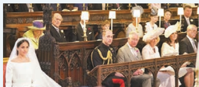
據王室傳統，無人能坐在英女王前面，空席與紀念戴妃無關。