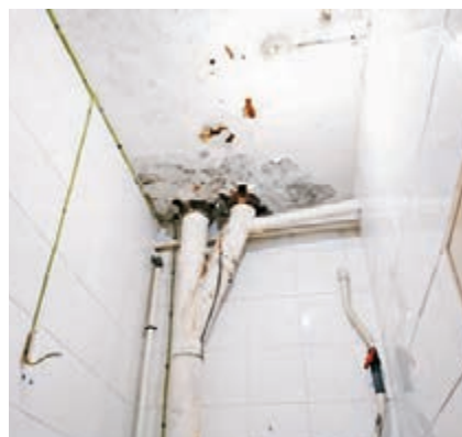
李太太家中洗手間有石屎剝落問題。

能及時安排維修工作，所以他要自費聘請裝修師傅進行維修，方便親友在農曆新年時到他家中拜年。