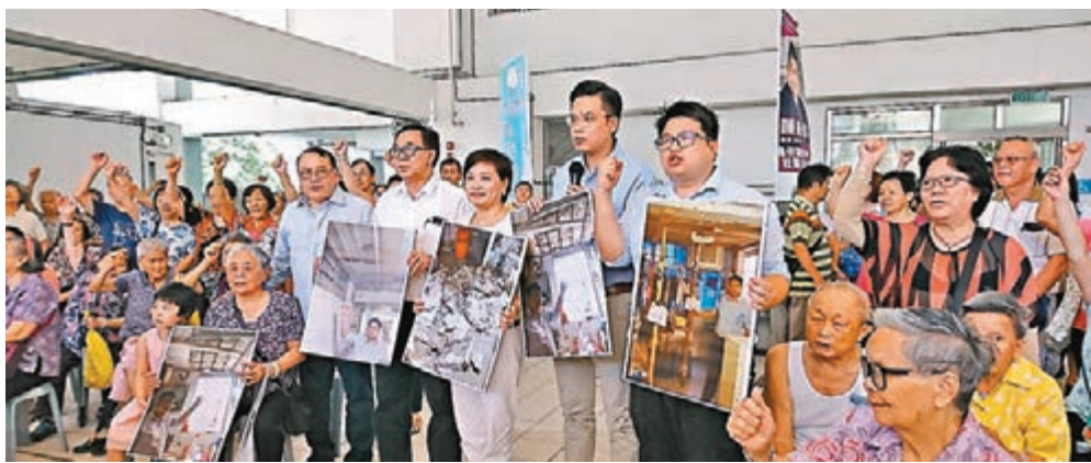
多名經民聯立法會議員及區議員出席石硤尾邨居民大會，為居民爭取重建。

陳國偉認為石硤尾邨的大廈結構已經出現問題，要經常維修，要求房署盡快重建石硤尾邨。他表示，附近亦有即將落成的新公屋可以讓居民原區安置，絕對符合政府重建公共屋邨的原則。