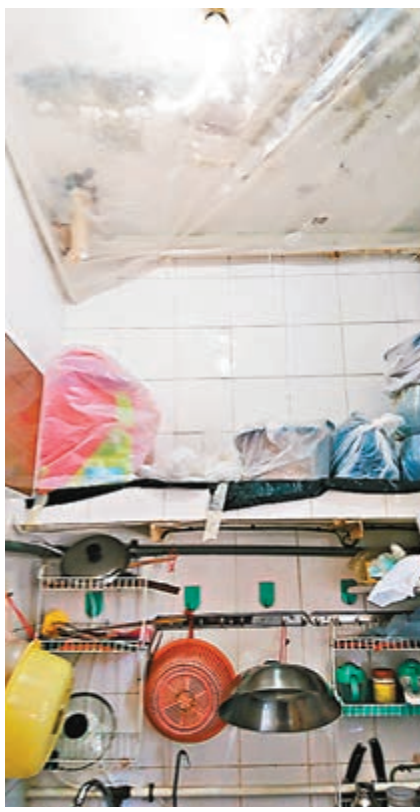
李太太在廚房加裝膠篷，阻擋石屎直接跌在食物上。

該區區議員陳國偉表示，石硤尾邨現時仍有9座舊樓，他不時接獲居民就關於樓宇結構問題的求助個案，透露半年