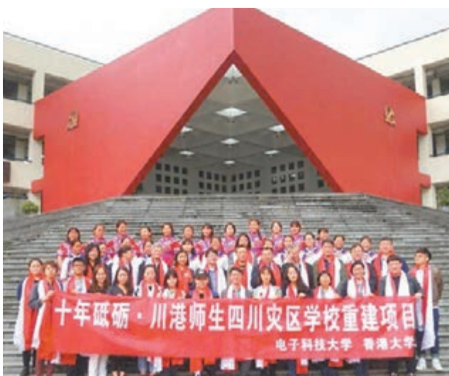
香港大學訪問團與電子科技大學志願者探訪災後重建的汶川映秀中學，延續川港兩地學生的交流。

黃偉倫對任何合作，不論是政府或大學層面都應該多做啟動性工作表示贊成，以期達至可持續發展。現在重建的歷史任務