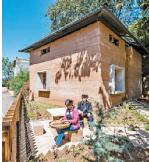
中大團隊為雲南光明村興建新型抗震土房。

疑，認為泥屋落後。不過，經過反覆測試，大家都發現他們協助興建的新房子，比想像中堅固耐用，而且冬暖夏涼，十分舒適，漸漸為村民和當地政府所接受。