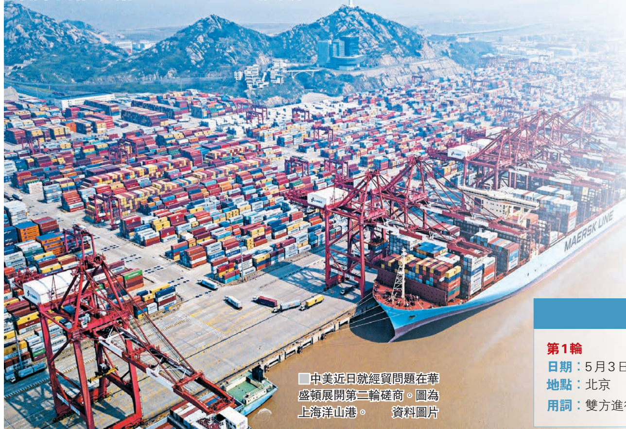
中美近日就經貿問題在華盛頓展開第二輪磋商。圖為上海洋山港。