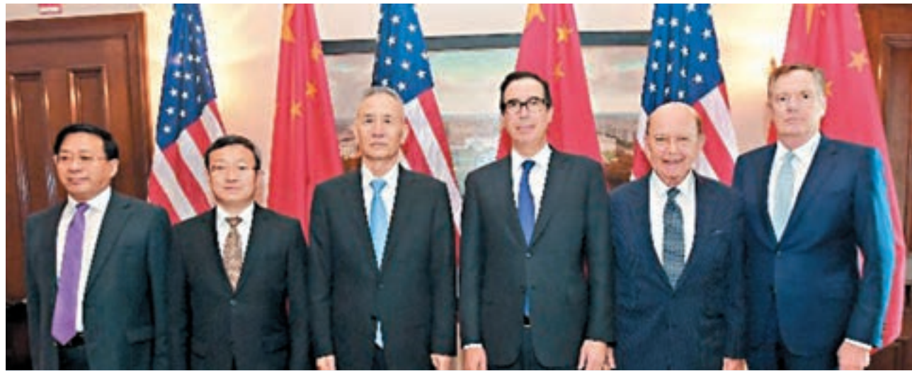
美國財政部長姆努欽(右三)17日在Twitter上載與劉鶴(左三)和中方代表團成員王受文(左二)、韓俊(左一)，以及美國商務部長羅斯(右二)和貿易代表萊特希澤(右一)的合照。