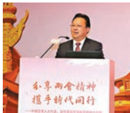
譚鐵牛在分享會上，介紹今年全國兩會的基本情況。

他希望駐港中資企業和香港工商界一道，秉承愛國愛港的優良傳統，帶頭融入國家發展大局，奮力開創自身發展新局，帶頭支持行政長官林鄭月娥和特區政府依法施政，帶頭維護香港社會和諧穩定，帶頭關心香港青年發展，帶頭推動香港同內地交流合作。