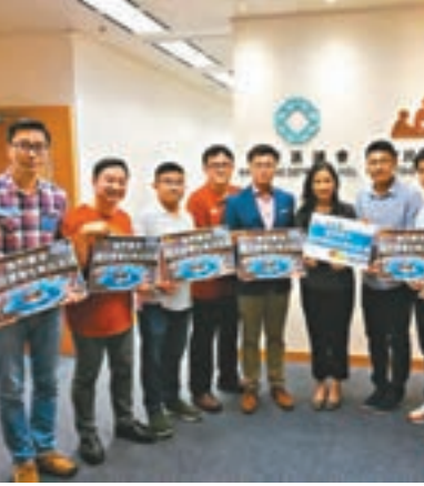
民建聯多名觀塘區議員要求，康文署盡快擴建佐敦谷游泳池。

佐敦谷游泳池目前的服務範圍覆蓋周邊20萬人口，加上區內有新屋苑即將入伙，及多個發展項目，該處僅有一個訓練池和4個小嬉水池將不敷應用。民建聯多名觀塘區議員，要求康文署盡快擴建佐敦谷游泳池。