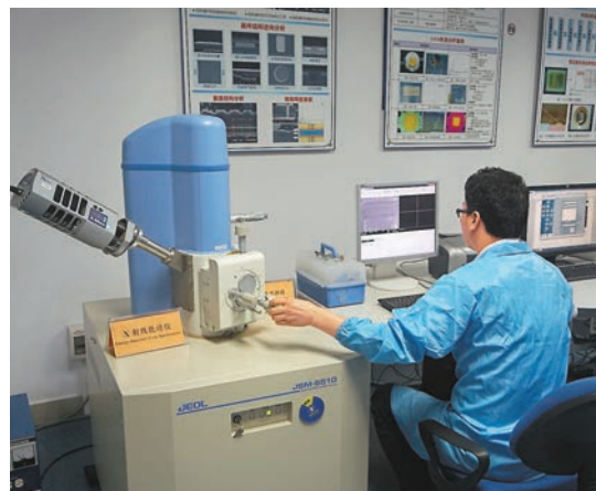
科大佛山研發中心的建設為南海帶來了香港科技大學先進的人才團隊和技術。