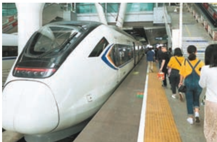
廣深城際「刷手機」進站措施有望擴展到其他鐵路線。

值得一提的是,旅客在手機上綁定銀聯支付卡便可實現「刷手機」進站。旅客無須再到窗口和自動售票機排隊購票,也無須提前網上購票,平均節約15分鐘左右。旅客「刷手機」閃付後,手機上隨即收到一條有乘車時間、車次、座位等信息的短信,同時,旅客也可通過下載註冊「雲閃付」APP自行查詢席位信息。