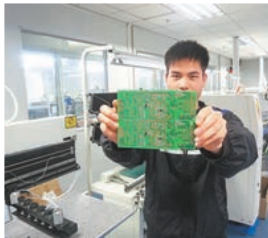
科大佛山研發中心研發人員展示產品。