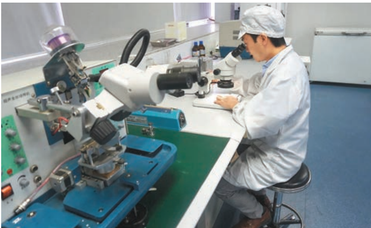
據悉,科大佛山研發中心為港科大與南海區一期合作項目。圖為科大佛山研發中心研究人員在做實驗。

昨日的推介會在香港科大於內地設立的三大科創平台之一——佛山香港科技大學LED-FPD工程技術研究開發中心(下稱「科大佛山研發中心」)舉行。據悉,本次推介會由香港科大深圳研究院院長、科大佛山研發中心主任李世璋教授主持。