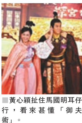
■黃心穎扯住馬國明耳仔行，看來甚懂「御夫術」。