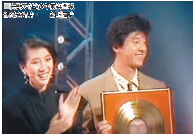
■梅艷芳(左)多年前為西城頒發金唱片。