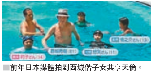
■前年日本媒體拍到西城借子女共享天倫。