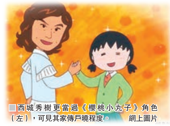
■西城秀樹更當過《櫻桃小丸子》角色(左)，可見其家傳戶曉程度。

當西城離世的消息昨日傳出後，「新御三家」成員鄉裕美發聲表示難過。「作為同年代的人，我感到非常可惜。在我心目中，（野口）五郎是大哥，二哥是秀樹，最細是我。秀樹行先一步，令我內心十分難過。出道那時，他對着什麼也不認識的我說『裕美，若有不明白可隨便問我』，我對此生難忘。」而2011年曾跟西城合演舞台劇的藤原紀香，透過經理人公司發聲追悼：「西城是我們心中永遠的巨星，感謝你。」