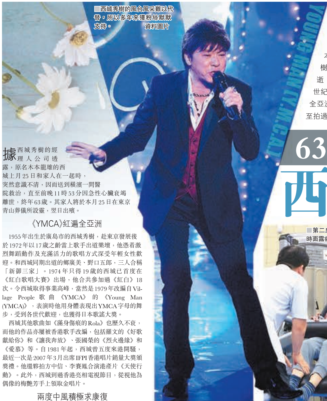
■西城秀樹的風采難以代替，所以多年來獲粉絲默默支持。資料圖片

據西城秀樹的經理人公司透露，原原本本龍雄的西城上月25日和家人在一起時，突然意識不清，因而送到橫濱一間醫院救治，直至前晚11時53分因急性心臟衰竭離世，終年63歲。其家人將於本月25日在東京青山葬儀所設靈，翌日出殯。