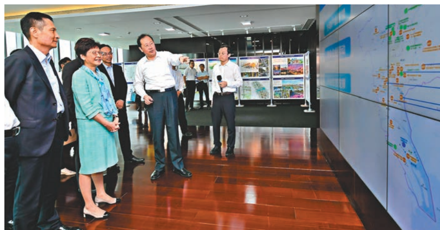
林鄭月娥在廣州考察規劃中的琶洲互聯網創新集聚區,了解該區作為互聯網技術創新平台的發展。中通社