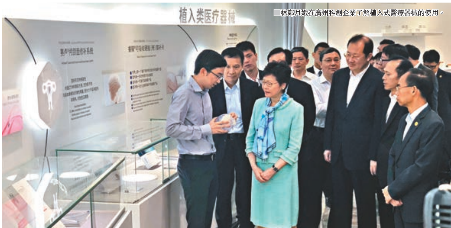
林鄭月娥在廣州科創企業了解植入式醫療器械的使用。