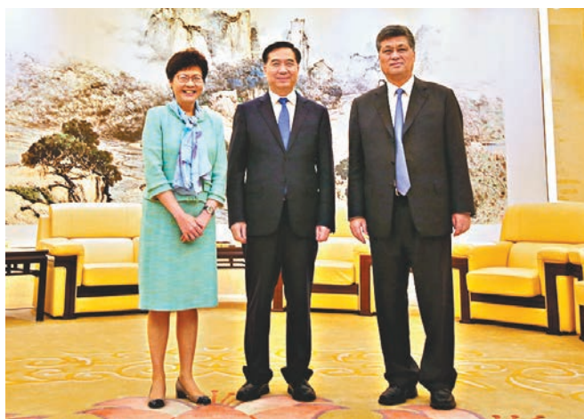
林鄭月娥與李希(中)、馬興瑞(右)會面。