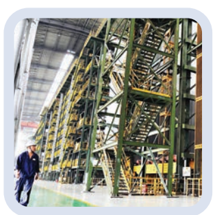
以新鋼公司為龍頭的新余鋼鐵及鋼材深加工產業集群