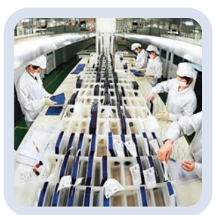
新余市正大力發展清潔能源