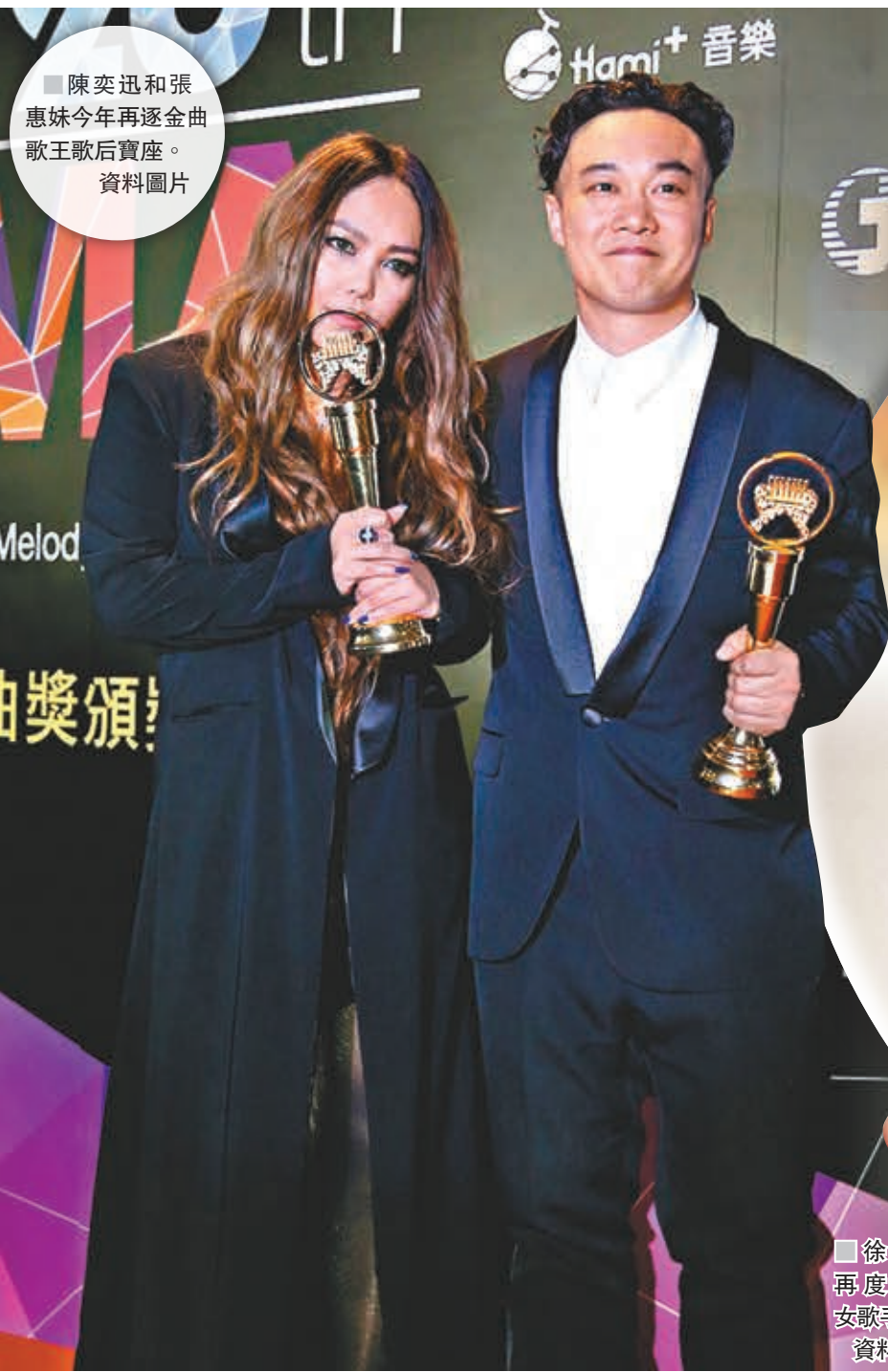
陳奕迅和張惠妹今年再逐金曲歌王歌后寶座。資料圖片