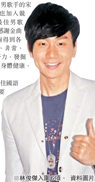
林俊傑入圍6項。

另外，今年盧廣仲以《魚仔》入圍年度歌曲、最佳作曲人獎、最佳作詞人獎、最佳單曲製作人獎4大獎。《魚仔》最後要和林生祥的《有無》，一爭金曲年度歌曲獎。