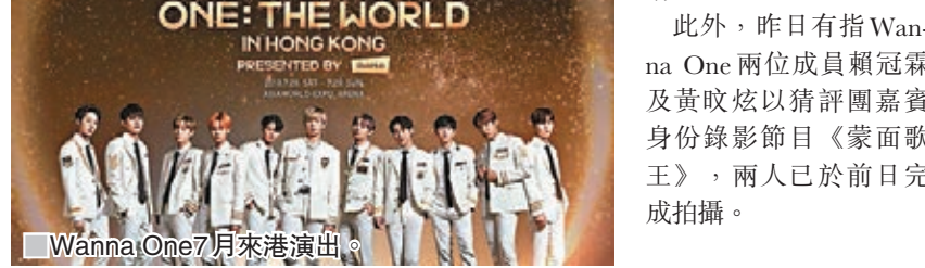
Wanna One 7月來港演出。

香港文匯報訊 韓國選秀節目《PRODUCE 101》Season2 出身的人氣男團Wanna One，將於7月28日及29日連續兩日假亞博館Arena舉行《Wanna One World Tour in Hong Kong》。門票將於5月29至30日優先發售，及於6月1日公開發售，相信屆時定掀撲飛熱。全位票價1,280至1,980(VIP)港幣不等，坐位票價580至1,680港幣不等，凡購買HK$1,980VIP門票的觀眾，將可參觀彩排或演唱會結束後的歡送活動。