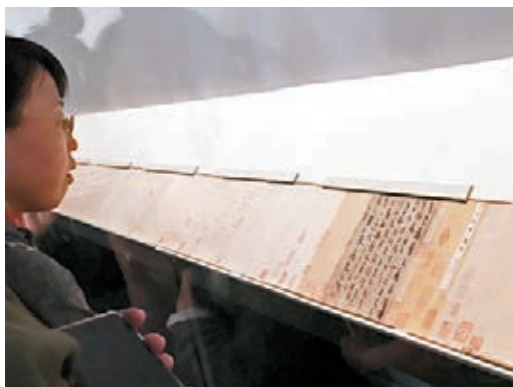
■ 觀眾在欣賞《平復帖》(複製品)。

如果沒有他傾家蕩產護國寶，《平復帖》《游春圖》等頂級書畫恐已流落國外；如果沒有他慷慨捐讓斷捨離，普通民眾將無緣與《諸上座帖》《道服贊》《百花圖》等國寶相遇……張伯駒這個名字要麼不知道，知道了就再難忘記。