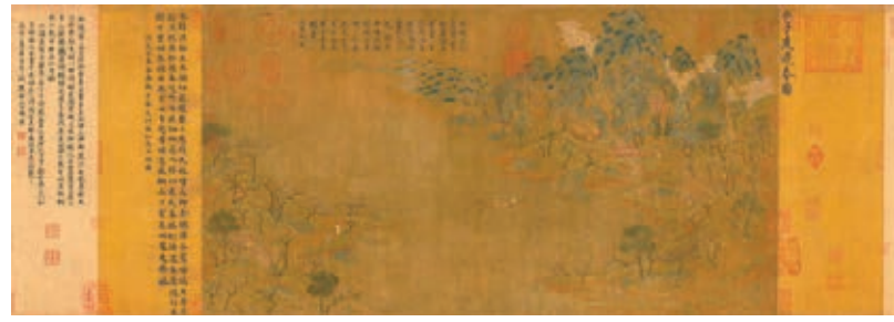
■隋展子虔(傳)《游春圖》卷(複製品)局部(故宮博物院藏)。

據故宮博物院統計，故宮共計收藏有張伯駒先生《叢碧書畫錄》著錄的古代書畫22件，幾乎件件堪稱中國藝術史上的璀璨明珠。單霽翔