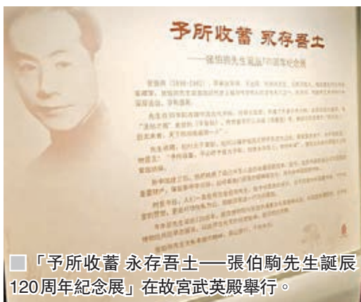
■「予所收蓄 永存吾土——張伯駒先生誕辰120周年紀念展」在故宮武英殿舉行。

1918年畢業於袁世凱混成模範團騎兵科，畢業後任安武軍全軍營務處提調、陝西督軍公署參議，後任鹽業銀行董事、總稽核。抗日戰爭勝利後，歷任華北文學院教授、故宮博物院專門委員、北平市美術分會理事長。新中國成立後任國家文物局鑒定委員會委員、第一屆北京市政協委員。1962—1966年任吉林省博物館副研究員、副館長。1972年被聘為中央文史館館員。1982年2月26日病逝於北京。張伯駒早年即喜收藏，所藏法書名畫甚眾，多為曠世絕品。