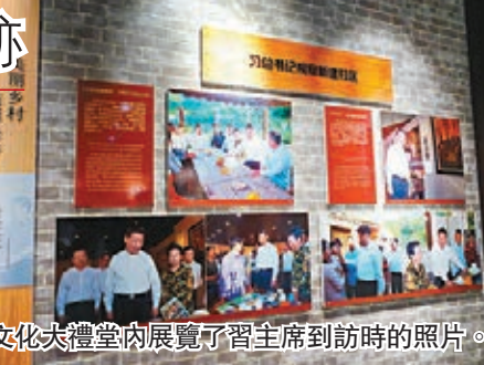
文化大禮堂內展覽了習主席到訪時的照片。

化大禮堂，可以入內參觀，地下是越劇發展展覽廳，展覽有資料及圖片介紹越劇與樂器，讓你了解越劇發展歷史。二樓展覽了習近平主席當年在浙江工作的記錄和2015年5月習近平總書記到定海走訪，和村民們圍坐在一起促膝交談，了解城鄉統籌發展和社區文化建設情況的相片及影片；以及南洞藝谷正在生態文化融合中逐漸發展成為休閒旅遊村，主席對這美麗鄉村的評價。而偏廳展覽了為舟山而創作的藝術作品，有畫、有工藝品，喜歡的可以買走。