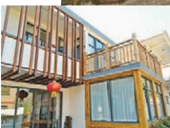
舟山南洞藝谷民宿正門

原來在2009年，首批300名藝術院校大學生來到「原生態」的南洞，拿起畫筆沉醉於這片山色中，進行了為期一周的采風寫生。浙江工業大學、華僑大學、寧波大學等15所院校相繼