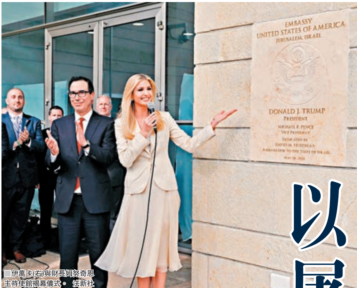
伊萬卡(右)與財長姆努奇恩主持使館揭幕儀式。