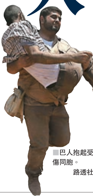
巴人抱起受傷同胞。