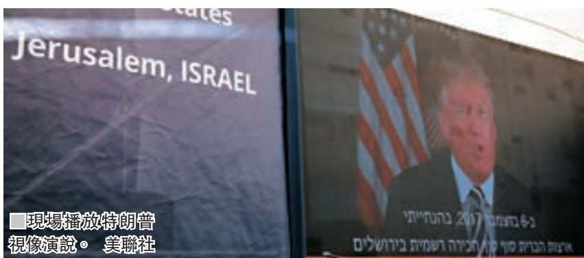
現場播放特朗普視像演說。

美國駐以色列新大使館昨日在全球反對聲下，於耶路撒冷揭幕，將持續數周的巴勒斯坦人反以及反美示威推向高潮。在控制加沙的巴人激進組織哈馬斯號召下，數以千計巴人示威者昨日向加沙接壤以國邊境推進，與以軍爆發流血衝突，以軍向巴人開火，示威造成至少43人死亡及2,200人受傷，其中86人情況嚴重或危殆，是2014年以來加沙死傷最慘重的一日，巴人政府指責以國進行「恐怖屠殺」。