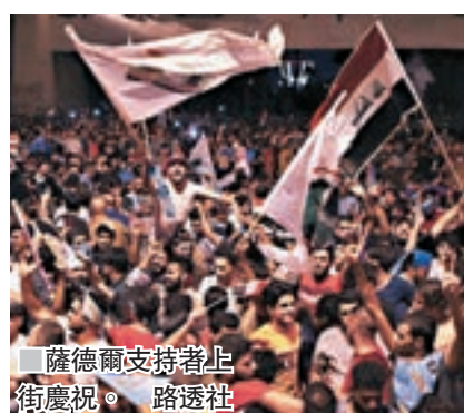
薩德爾支持者上街慶祝。