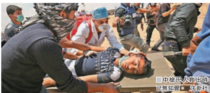
中槍巴人救出時已無知覺。

哈馬斯揚言號召10萬名巴人衝擊以國軍建立的邊境圍欄。以國派出軍機在上空投放單張，警告示威者接近邊境將有生命危險，呼籲巴人不要成為哈馬斯的工具，並針對巴人準備焚燒車胎抗議，預先出動無人機噴灑易燃液體及點火燒毀車胎。