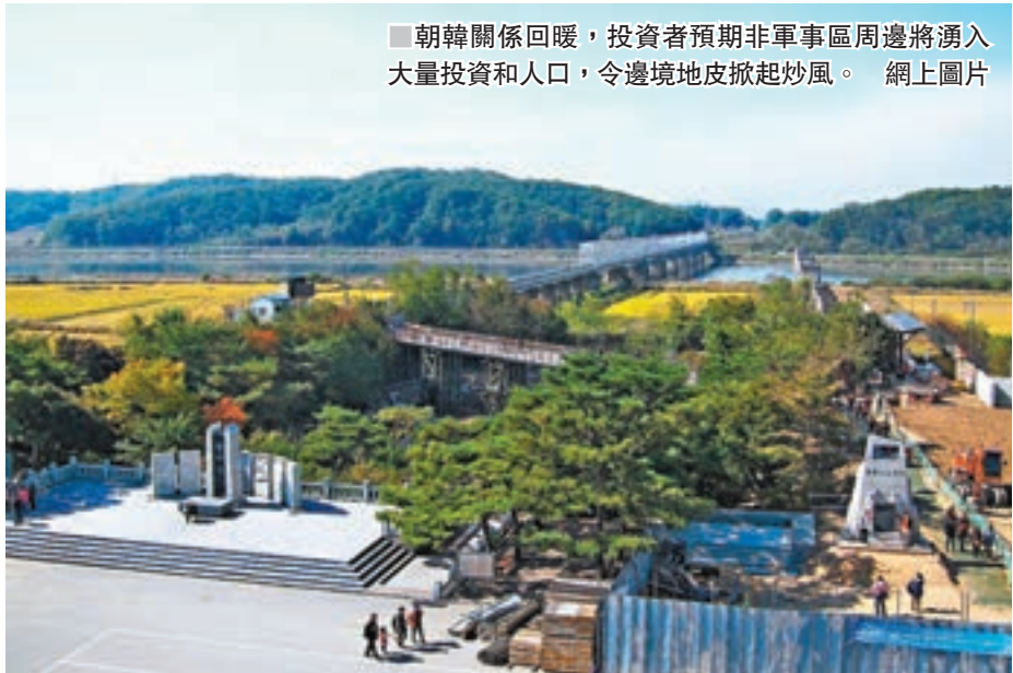
朝韓關係回暖，投資者預期非軍事區周邊將湧入大量投資和人口，令邊境地皮掀起炒風。網上圖片