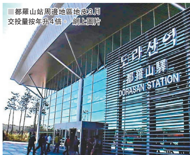
都羅山站周邊地區地皮3月交投量按年升4倍。

除了韓國北部邊境受惠於「朝鮮概念」，作為中國與朝鮮交流門戶的遼寧省丹東市，亦出現房地產交易急增的現象。由於憧憬朝韓修好後，中朝韓三國可能修建連接韓國至中國的鐵路，韓國基建及鐵路公司現代Rotem和Seam機械工業等，股票近日亦受到追捧。