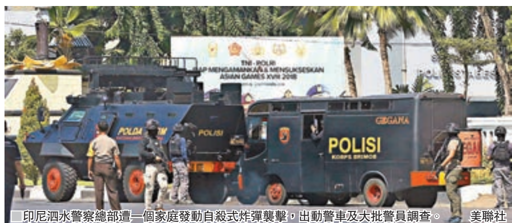
印尼泗水警察總部遭一個家庭發動自殺式炸彈襲擊，出動警車及大批警員調查。