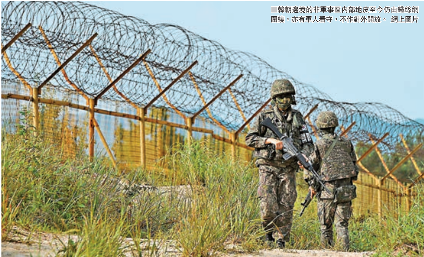
朝韓邊境的非軍事區內部地皮至今仍由鐵絲網圍繞，亦有軍人看守，不作對外開放。