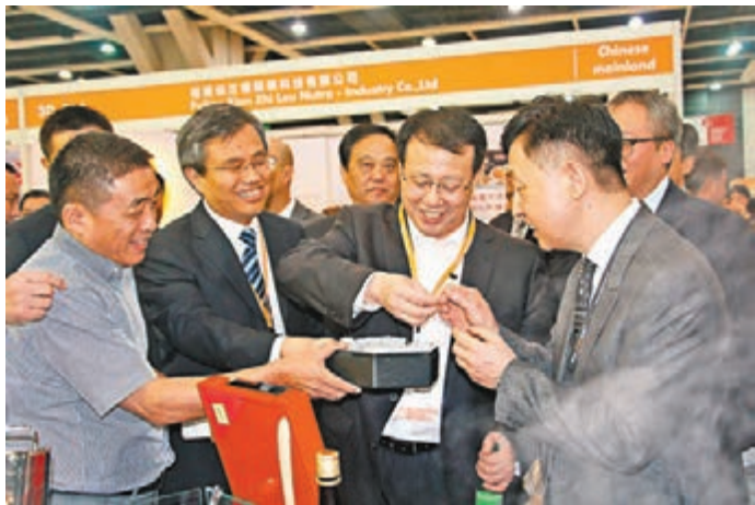
山東品牌企業參加2017香港美食博覽。

香港文匯報訊(記者 楊奕霞 山東報導) 2018「山東品牌中華行」再設香港站,山東老字號品牌將於今年8月16-20日赴港參加2018香港美食博覽。