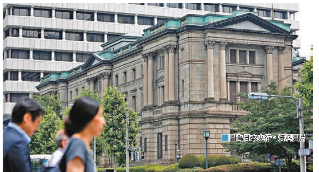
圖為日本央行。資料圖片

倍,市盈率較過去10年平均的20.7倍為低,而美股及環球指數的市盈率分別為18.6倍及18.8倍,可見日股估值較吸引。