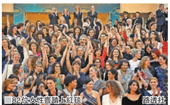
■82位女影人踏康城紅毯撐平權。