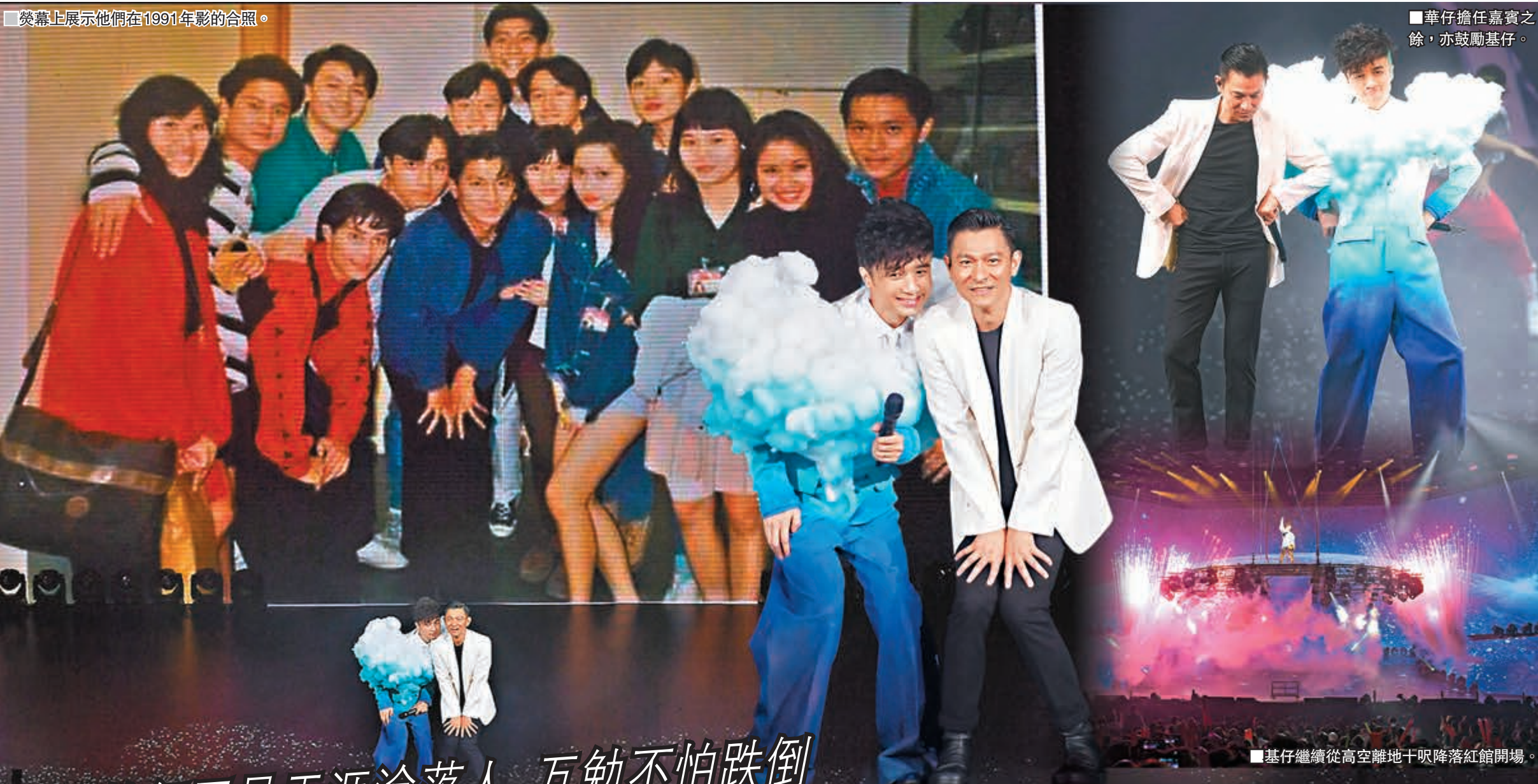
■華仔擔任嘉賓之餘，亦鼓勵基仔。