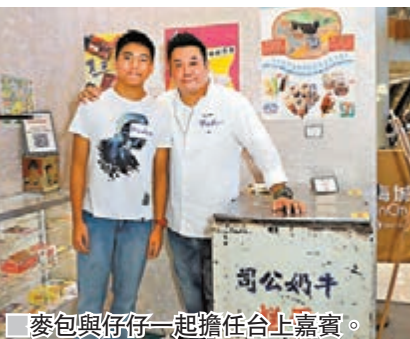
■麥包與仔仔一起擔任台上嘉賓。