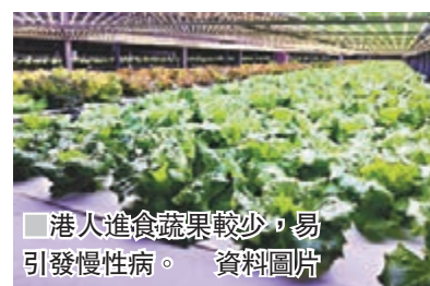
港人進食蔬果較少，易引發慢性病。