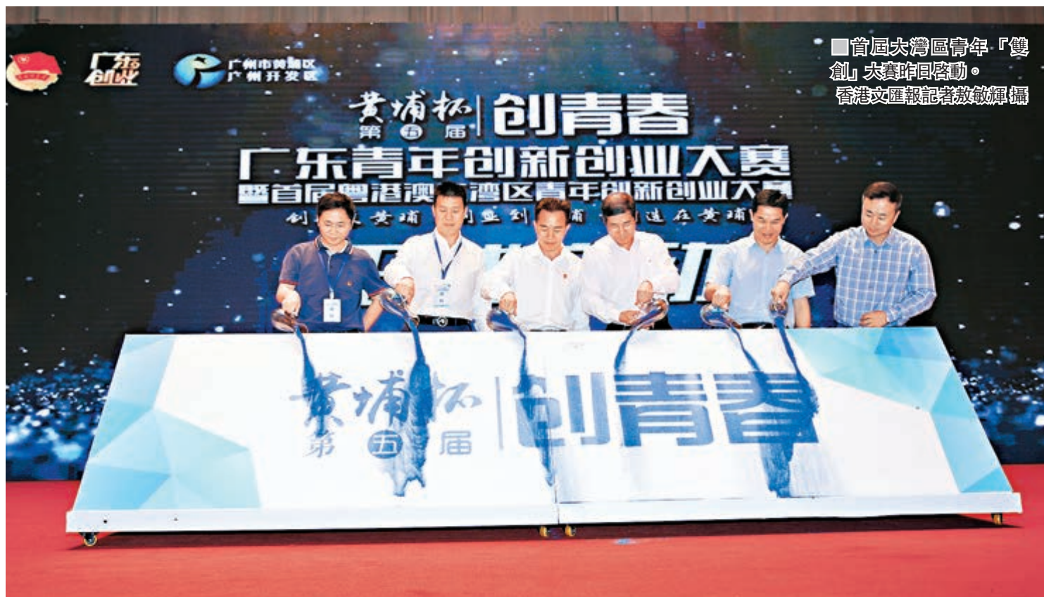
■首屆大灣區青年「雙創」大賽昨日啓動。香港文匯報記者敖敏輝攝