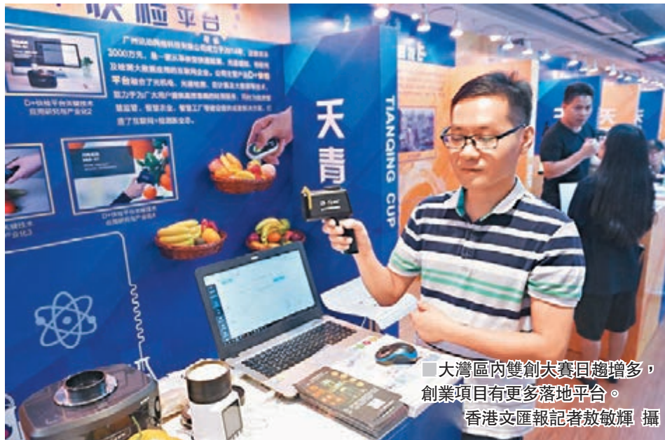
■大灣區內雙創大賽項目增多，創業項目有落地平台。

香港文匯報訊（記者 敖敏輝 廣州報道）代表三地青年創新創業競技最高水平的首屆粵港澳大灣區青年創新創業大賽昨日在廣州黃埔區啓動。此屆大賽分設商工組和農業農村組，重點關注新一代信息技術、生物製藥、人工智能等近20個領域。香港專項賽將在本月17日舉行的香港創業日活動上啓動報名，設創意類和創業類兩大組別，吸引35歲以下香港青年團隊及其項目。複賽期間，三地青年將同場競技，角逐百萬元（人民幣，下同）獎金。主辦方將搭建六大雙創平台，為優質參賽項目落地和企業成長提供全體系服務。