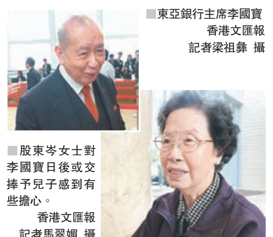
股東岑女士對李國寶日後或交棒予兒子感到有些擔心。