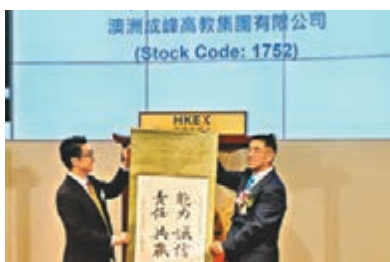
澳洲成峰高教首日掛牌升近兩成。