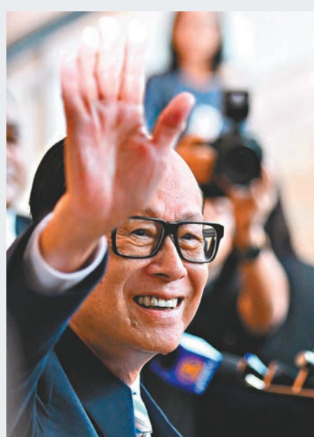
李嘉誠退任長和主席,在許多市場人士眼中,是「一個時代的終結」。

香港文匯報訊(記者周紹基) 港股昨日承接外圍升勢,加上騰訊(0700)午後挾升,帶動港股全日再升273點,升至30,809點,收復50天線(30,661點)及100天線(30,754點),連升4日,已累漲了883點,成交額也略回升至938億元。國指也反覆升0.4%,報12,233點。長和(0001)主席李嘉誠昨日正式退任主席一職,長和及長實(1113)略偏軟,均跌0.2%。