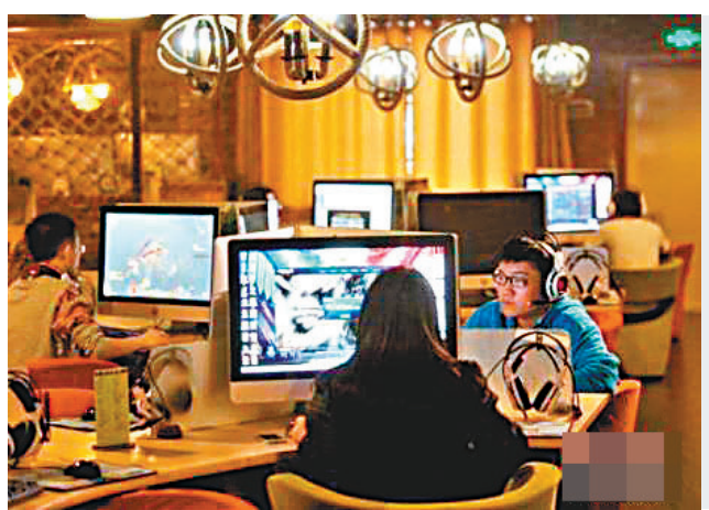
上海社會科學院課題組昨日發佈的中國首份數字貿易發展研究報告稱, 當前上海網絡遊戲發展速度領跑全國。圖為玩家在網吧玩網絡遊戲。資料圖片

報告指出, 2014年上海在全國率先試點網絡遊戲地審批以來, 企業因審批時間明顯縮短而獲益, 對網絡遊戲企業在上海創業發展增強了吸引力。2016年, 中國約有3,800款國產遊戲獲批, 上海佔了31%, 當年在移