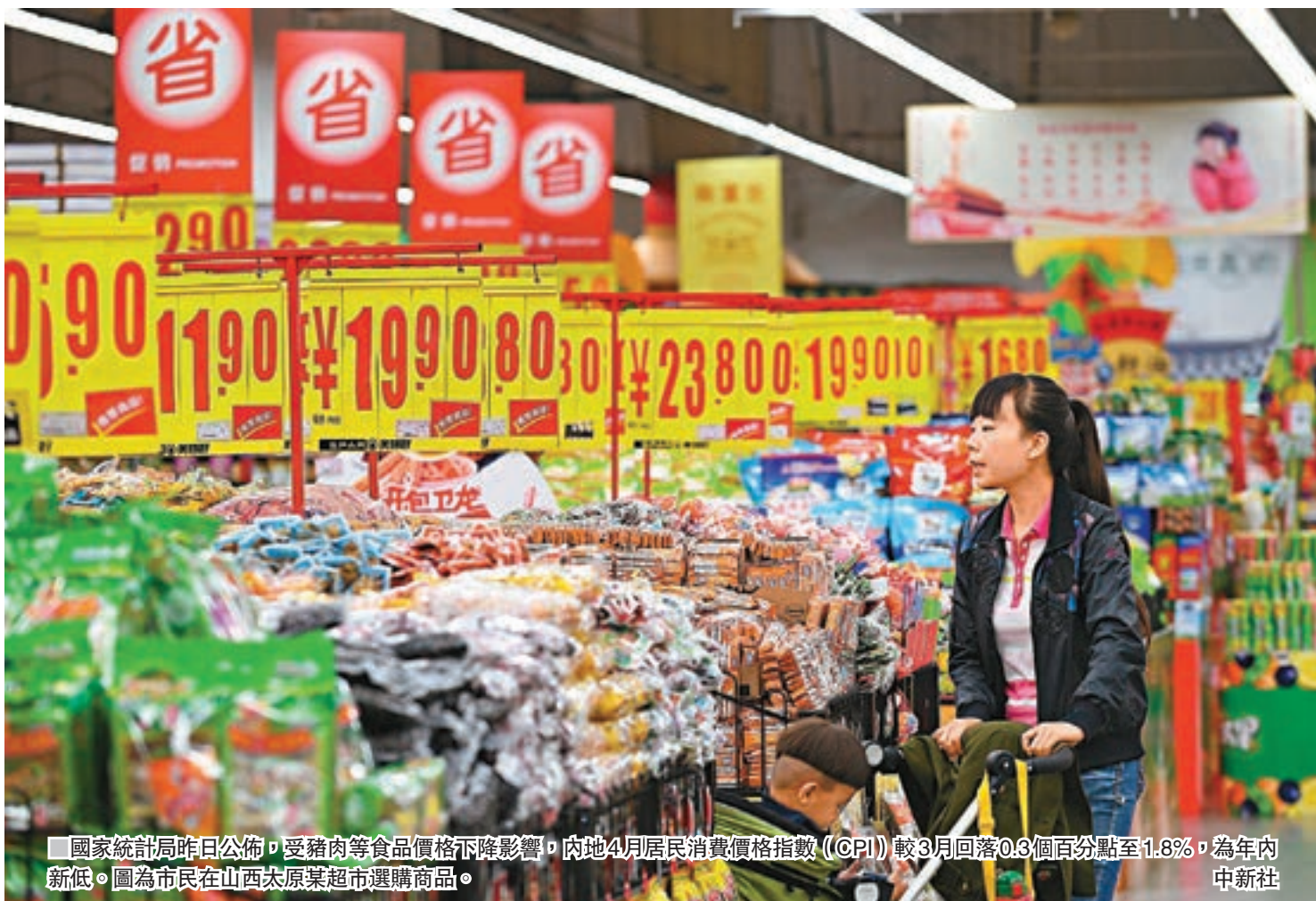
國家統計局昨日公佈, 受豬肉等食品價格下降影響, 內地4月居民消費價格指數(CPI) 較3月回落0.3個百分點至1.8%, 為年內新低。圖為市民在山西太原某超市選購商品。

國家統計局城市司高級統計師魏國慶表示, CPI同比漲幅回落, 主要是豬肉價格下降16.1%, 影響CPI下降約0.43個百分點; 影響CPI同比上漲主要因素則來自醫療保健、教育服務、居住類等非食品類價格, 影響CPI上漲約1.67個百分點。