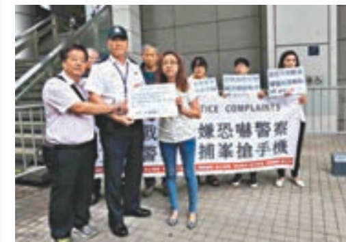
警方代表接收示威者的請願信。

示威者強烈譴責「鍵盤戰線」肆意侵犯警務人員個人私隱,及誣衊警察的公正執法行為,促請警方追究事件,好好保護警務人員個人和家庭成員不受網絡欺凌。