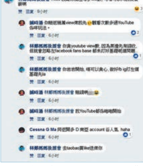
陳時潘承認拍片為賺錢。