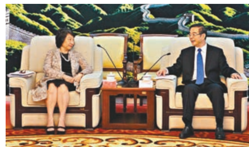
鄭若驊(左)在北京與周強會面。

鄭若驊高度讚賞近年來內地法治建設取得的成就,表示願意進一步加強交流,深化務實合作,切實增進兩地人民福祉。