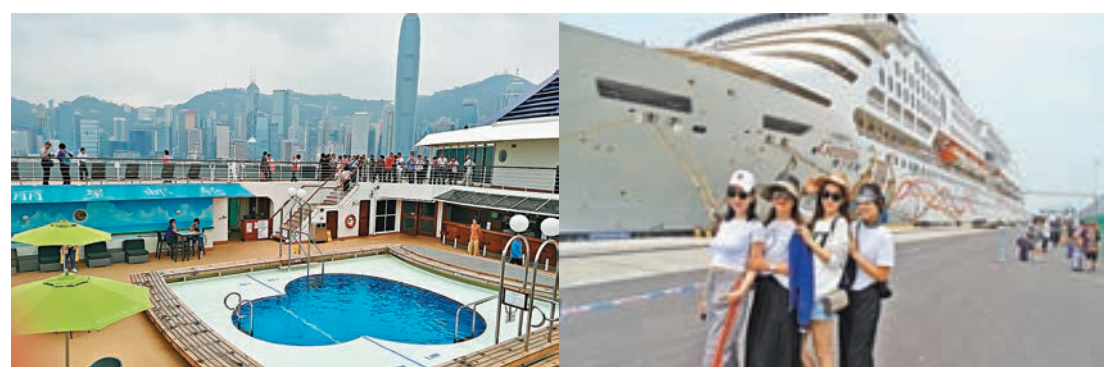
由上郵輪一刻，已是旅程的開始。