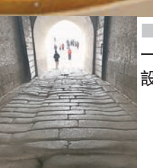
大小不一條石鋪設