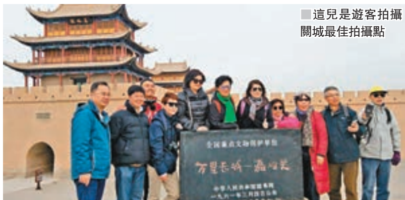
這兒是遊客拍攝關城最佳拍攝點