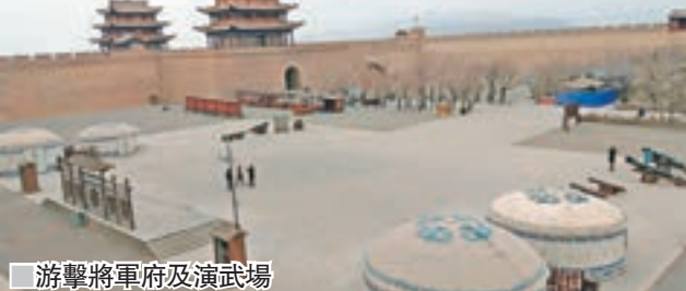
游擊將軍府及演武場