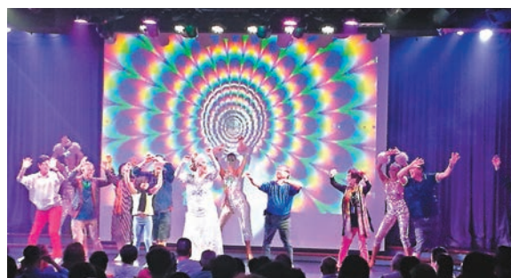
有荷美郵輪由香港到台灣、日本、馬尼拉...