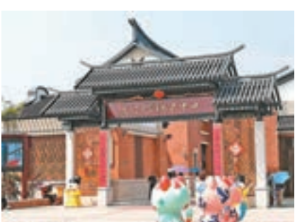
廈門文創展示中心