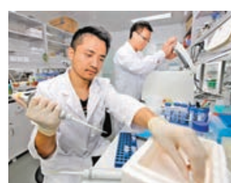
大灣區各城市中，深圳的定位為高新技術研發中心。 資料圖片

們之間優勢互補的方法。香港可以繼續增強其在金融和專業服務領域的優勢，深圳可以利用其在高科技製造和創新方面的專長，而廣州和東莞則可以發揮它們的製造能力。因此，大灣區有能力成為世界上最多元化的城市群。