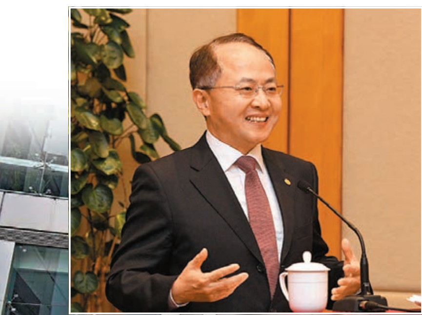
中聯辦主任王志民主持召開中聯辦領導班子會議。

香港文匯報訊 據中聯辦網訊，5月9日，中聯辦主任王志民主持召開中聯辦領導班子會議，學習貫徹習近平總書記在紀念馬克思誕辰200周年大會上發表的重要講話精神。解放軍駐港部隊司令員譚本宏及中聯辦副主任等參加會議。