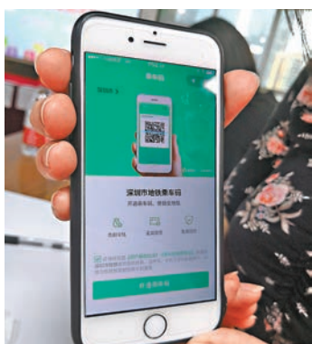
乘客需先開通「乘車碼」功能。