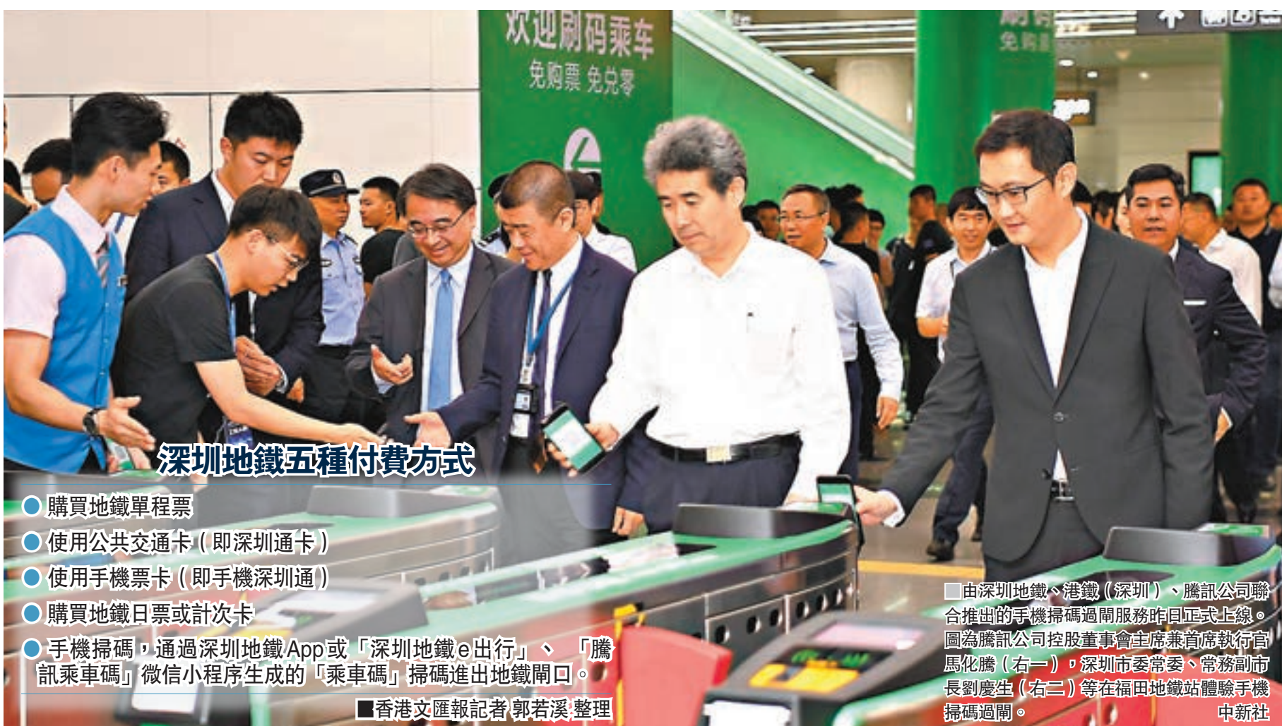
深圳地鐵五種付費方式

乘客使用「乘車碼」進出閘,如未遵循「一進一出」的使用規則,導致30天內累計發生3次以上記錄缺失,系統將限制該「乘車碼」乘車功能,乘客需補繳票款後方可繼續使用;一年內累計發生10次以上的,將被視作逃票行為,納入個人信用信息系統。