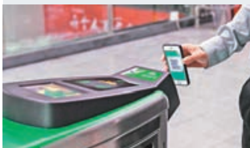
乘客在深圳地鐵福田站用手機掃碼乘車。