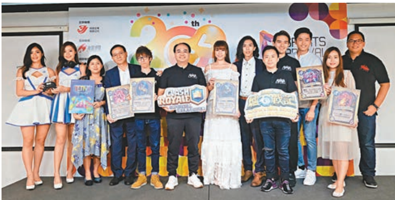
■第二十屆香港動漫電玩節將在7月底舉行。

另外,CSL Mobile Limited、Amethyst Limited、Netmarble Joybomb Inc.、Play Infinite Limited 及 MiHoYo Limited 等多間參展商亦會舉辦不同的電競活動,而今年的展覽期間亦會繼續有兒童玩具節及「劊天綜同人祭」等活動。