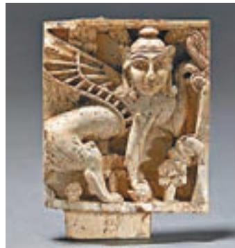
■腓尼基象牙雕刻飾板。