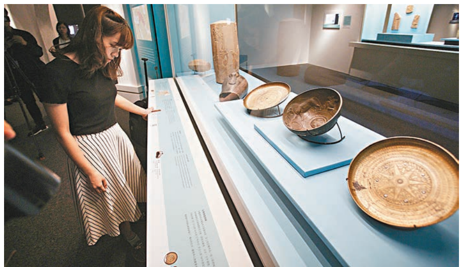
■康文署及大英博物館聯辦《奢華世代:從亞述到亞歷山大》展覽。

展期: 5月9日至9月3日 地點: 香港歷史博物館專題展覽廳及一樓大堂 標準票: 10元 團體票: 7元(20人或以上) 優惠票: 5元(全日制學生、殘疾人士及一名同行照料者、60歲或以上人士) 免票: 博物館通行證持有人及由攜票成人陪同的四歲以下小童 展品數量: 210件古代地中海及中東地區古代奢侈品 展品種類: 象牙、珠寶、金銀製品、金屬製品和石浮雕 ■整理: 香港文匯報記者 殷翔