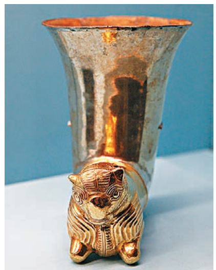
■土耳其出土公元前500年金、銀製角型酒杯。香港文匯報記者劉國權攝