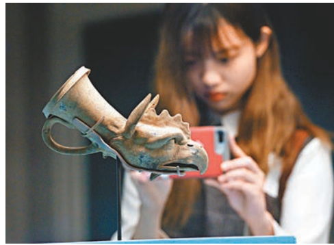
■亞述帝國象徽物:獅鷲頭像。