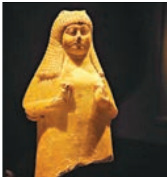
■巴比倫手握蓮花石罐。