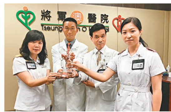
■團隊自2015年底起,推行「促進術後康復綜合方案」。

尼基人曾主導奢侈品市場,他們精於雕刻象牙、製造金屬和玻璃器物。阿契美尼德黃金香油瓶,以錘平的金片製成栩栩如生的金魚造型,工藝造詣超絕。空心的魚腹有夾層,推斷此瓶是用於存放昂貴的香油。這個金魚瓶是於現今塔吉克斯坦阿克瑟斯河附近發現,是至今阿契美尼德時期金銀器最重要的發現。希臘玻璃香油瓶,曾用於存放珍貴的化妝品或香油,瓶身的透明玻璃透現層層色彩和金箔。此器物於腓尼基(今黎巴嫩)製造,當時腓尼基已成為亞歷山大帝國龐大帝國的一部分。■香港文匯報記者 殷翔