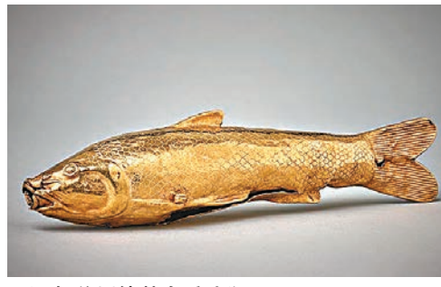
■阿契美尼德黃金香油瓶。