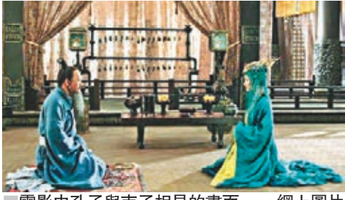
電影中孔子與南子相見的畫面。

而異之。」各種版本描述，孔子身高一米九左右，堪稱古代版「姚明」。他剛出生時，頭頂凹陷，如一山丘，其母以為是個怪物，差點將他遺棄。長大後孔子外貌仍存不少缺陷，諸如鼻孔外翻、雙眼凸出、大暴牙齒、大耳垂肩、雙手過膝、身材不勻等等。但「人不可貌相」，大凡見過孔子的人，都會被他溫和而充滿正氣、威嚴而不兇猛、謙虛而親和的內在氣質所吸引。孔子還不是手無縛雞之力的文弱書生，他臂力過人，曾獨自推出陷入泥潭的馬車。孔子還有海量，他周遊列國豪宴百次，總能以一擋十、從無醉倒。熱愛生活的孔子更是一位浪漫之人，他說自己很嚮往在暮春時分穿上春裝、約五六好友、帶上六七兒童、去沂水之濱遊覽，在祭祀的土台上吹吹風、唱唱歌……孔子從三千多首春秋詩歌中選出305篇編成《詩經》，那時他已年過七旬。而詩經首篇就是描寫愛情的《關雎》，可見愛美之心人皆有之，孔老夫子也喜歡淑女，但不是南子那一類。此乃人性的閃光，也是孔夫子可愛之處，他並非人們想像中整天板着面孔、憂國憤世的样子啊！