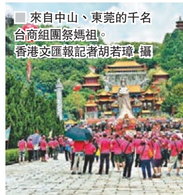
來自中山、東莞的千名台商組團祭媽祖。

每逢農曆三月廿三「媽祖誕」，來自中山(台灣)勝母宮、東莞(台灣)朝安宮的台商組成「千人拜祭團」齊聚東南亞最大媽祖廟——南沙天后宮，為天上聖母媽祖「暖壽」，並以台灣傳統儀式朝拜祭祀。