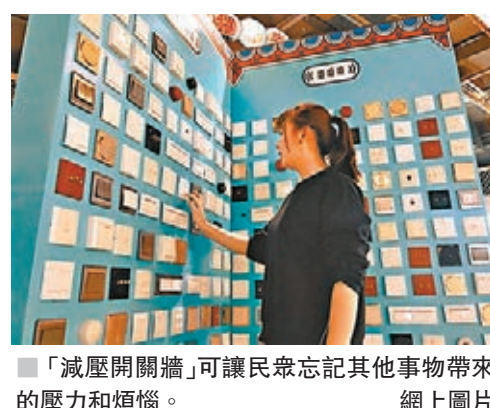
「減壓開關牆」可讓民眾忘記其他事物帶來的壓力和煩惱。網上圖片