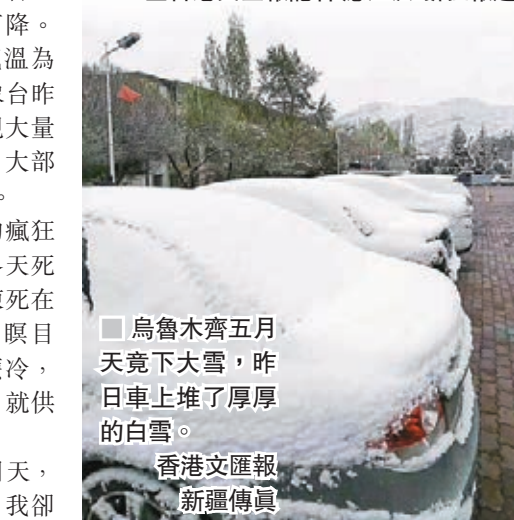
烏魯木齊五月天竟下大雪，昨日車上堆了厚厚的白雪。香港文匯報 新疆傳真