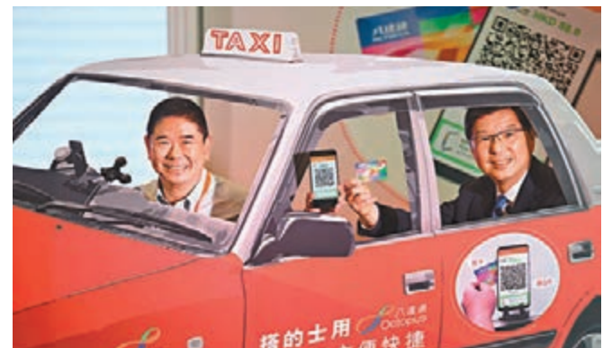
最新商用版八達通應用程式提供的士支付服務，乘客可透過八達通卡向接受服務的的士司機支付車資。資料圖片