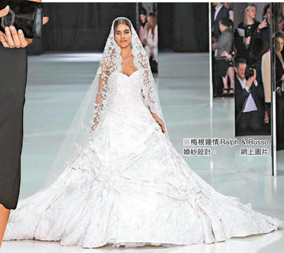
梅根鍾情Ralph & Russo婚紗設計。