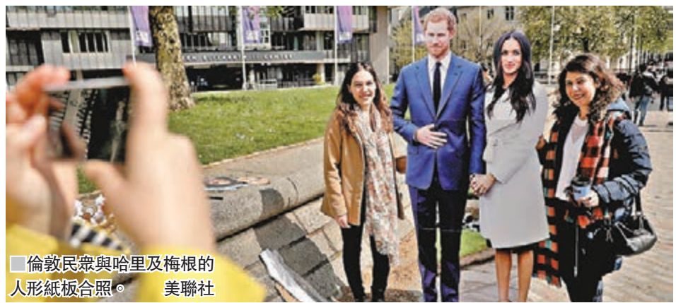
倫敦民眾與哈里及梅根的人形紙板合照。