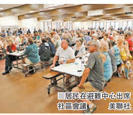
居民在避難中心出席社區會議。

萊拉尼及拉尼普娜花園住宅區附近地面出現裂縫，有蒸氣及岩漿冒出，並充斥有毒氣體。當局呼籲老人、小孩及患有呼吸系統疾病的居民必須盡快撤離。一名疏散居民表示，她的88歲母親非常擔心毒氣問題，因此帶同手提氧氣筒逃生。基拉韋厄火山是全球最活躍火山之一，大島近期錄得數以百計小型地震，導致火山於周四爆發，噴出大量熔岩及煙霧。