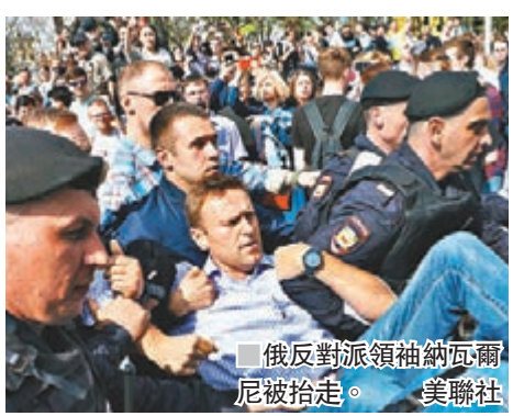
俄反對派領袖納瓦爾尼被抬走。