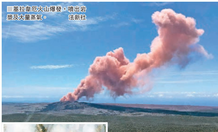
■基拉韋厄火山爆發，噴出岩漿及大量蒸氣。