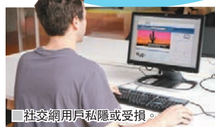
社交網用戶私隱或受損。

微博 twitter 前日爆出用戶資料外洩危機，由於內部程式故障，導致大量用戶的密碼未經加密處理，便儲存在公司的資料庫內，內部職員可自由取閱。基於私隱安全理由，twitter 要求超過3.3億用戶盡快更改賬戶密碼。twitter 技術總監阿格沃爾未公開具體受影響的用戶數據，但有消息人士指數目相信非常龐大，已持續數月。