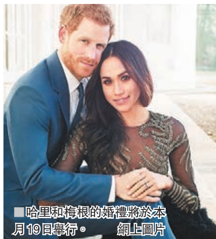
■哈里和梅根的婚禮將於本月19日舉行。

英國哈里王子和美國女星梅根的婚禮將於本月19日舉行，2,640名賓客獲邀出席，當中包括1,200名英國各地民眾，他們前日突然收到王室通知，指婚禮將不向他們提供午餐，需自備餐點出席。有收到通知的人形容措措莫名其妙，認為王室如此富有，卻吝嗇一頓午餐。