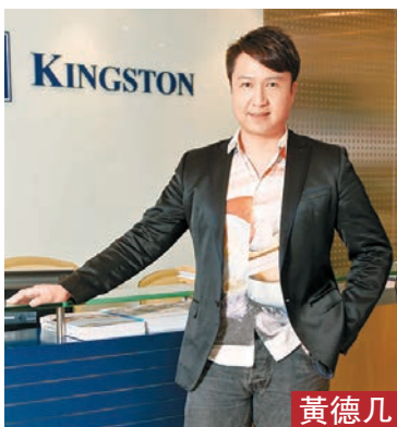
金利豐證券 研究部執行董事

永達汽車(3669)為內地豪華及超豪華汽車品4S代理商，於去年底已開業及獲授權開業網點，遍佈內地4個直轄市及16個省份，以及97家二手車零售網點，包括OEM品牌認證經營網點47家，4S店銷售網點24家及「永達二手車商城」連鎖網點26家。