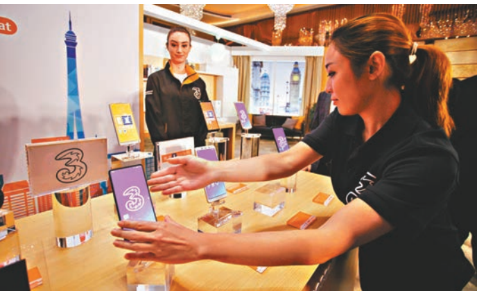
■長和與小米合組聯盟，有助小米加速擴展其國際銷售網。

們利潤的主要來源。」具體而言，這是小米獨創的「鐵人三項」商業模式：硬件+新零售+互聯網服務，「我們把設計精良、性能質量出眾的產品緊貼硬件成本定價，通過自有或直供的高效線上線下新零售渠道直接交付到用戶手中，然後持續為用戶提供豐富的互聯網服務。」他指，小米至今的成就說明了這一模式強大的生命力，創業僅7年時間，年收入就突破了千億元人民幣，這一成長速度是許多傳統公司無法企及的。